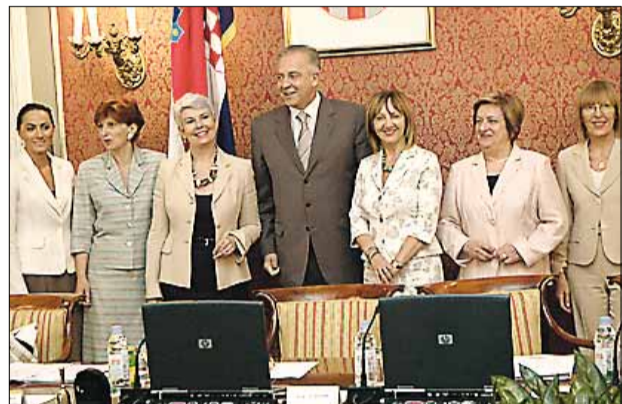
Među "europskim" zakonima i ravnopravnost spolova

Od dokumenata koje je Vlada planirala za treće ovogodišnje tromjesečje, na današnjoj je sjednici prihvaćen Prijedlog Zakona o potvrđivanju Konvencije Vijeća Europe o pranju, traganju, privremenom oduzimanju i oduzimanju prihoda stečenoga kaznenim djelom i o financiranju terorizma, kao i nacrt prijedloga Strategije upravljanja vodama. ZKV