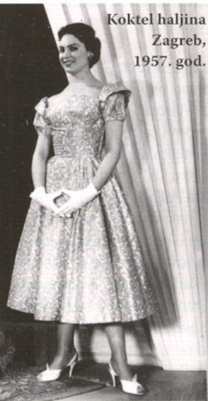
Koktel haljina Zagreb, 1957. god.