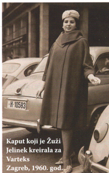
Kaput koji je Žuži Jelinek kreirala za Varteks Zagreb, 1960. god.

industriju konfekcije u inozemstvu: bila je prva krojačica koja je organizirala zapažene modne revije u brojnim svjetskim metropolama. Ta je činjenica bila presudnom i prilikom izbora naslova izložbe Ambasador mode – Žuži Jelinek, koji smo preuzeli iz novinskoga članka objavljenoga u tjedniku Globus 1960. godine. Krajem 50-ih godina 20. stoljeća Žuži Jelinek