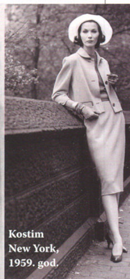
Kostim New York, 1959. god.