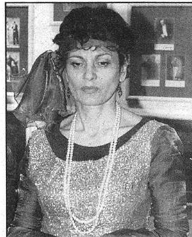
Dama s početka 19. stoljeća

Razgovarali smo i s maskiranim građanima od kojih su neki maske stavili i svojoj djeci. Nisu htjeli otkriti