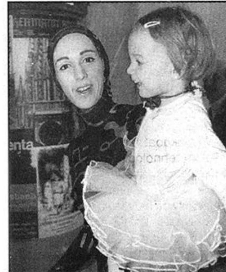
Maskirali su se i posjetitelji muzeja

imena jer maske su tajna. No, otkrili su da im je u Muzeju najljepši maskenbal jer upoznaju povijest svoga grada na vrlo ležeran i dojmljiv način.