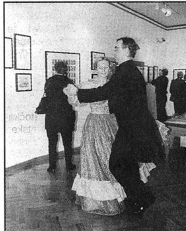
Ilirski ples

Mi nismo pile, to su radili samo naši muževi – rekla je jedna od dama, nazdravljajući bijelim vinom.