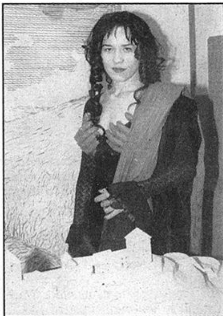
Crna kraljica, vladarica Medvedgrada

• Zaposlenici muzeja odjeveni kao likovi iz stalnog postava ispričali su posjetiteljima povijest Zagreba