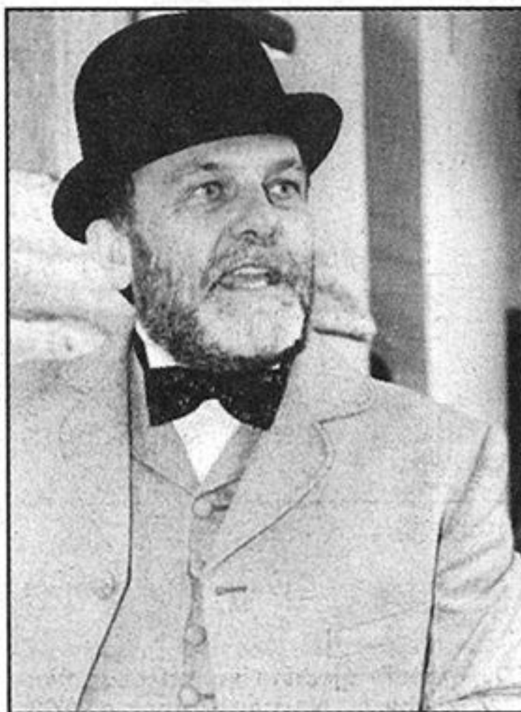
Herman Bollè graditelj zagrebačke katedrale

Već treću godinu za redom Muzej grada Zagreba, u fašničko vrijeme, organizira kulturnu manifestaciju pod nazivom 'Žive slike'. Zaposlenici muzeja 9. i 10. veljače opet su bili odjeveni kao likovi sa slika iz stalnog postava muzeja.