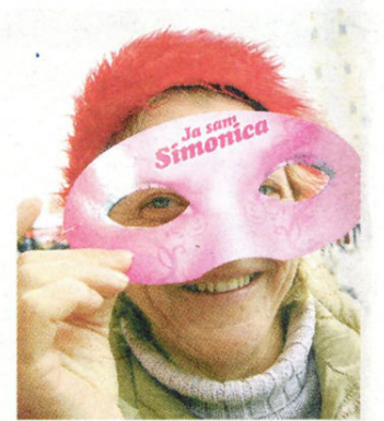
Na Večernjakovu štandu dijelile su se krunice celebrityja