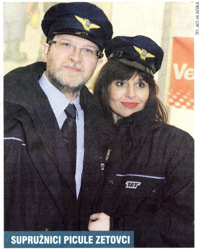
SUPRUŽNICI PICULE ZETOVCI