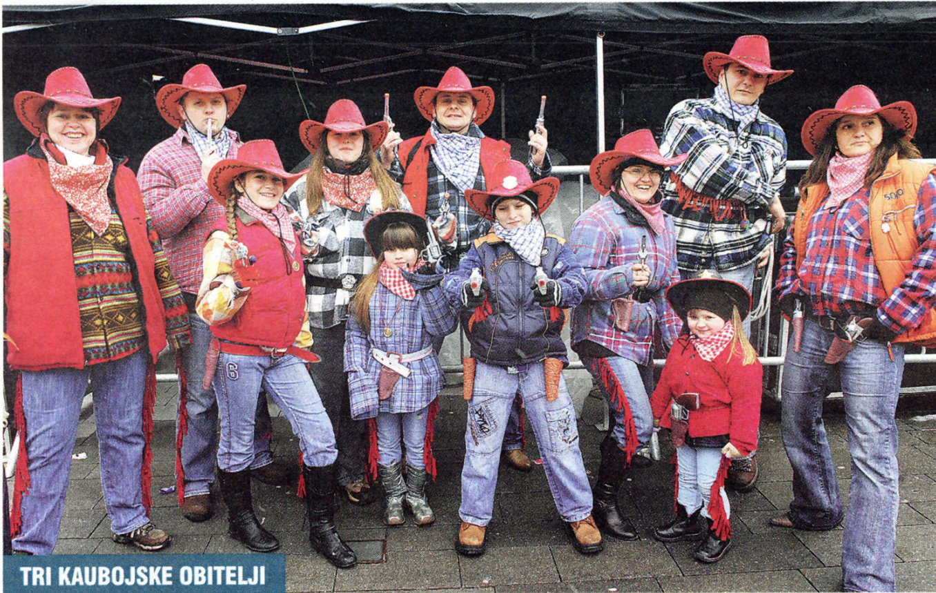
TRI KAUBOJSKE OBITELJI