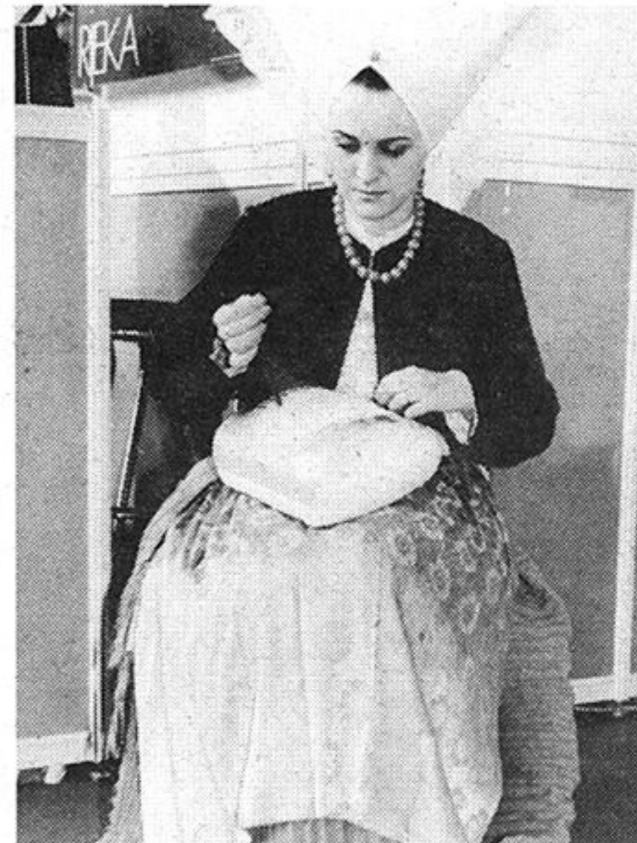
Kako se veze paška čipka

Žive slike u Muzeju grada Zagreba živjele su 24. i 25. veljače za sve nas. Bolje rečeno, za oko tisuću posjetitelja muzeja koji su se družili sa Zagrebom iz prošlosti, sa njegovim žiteljima.