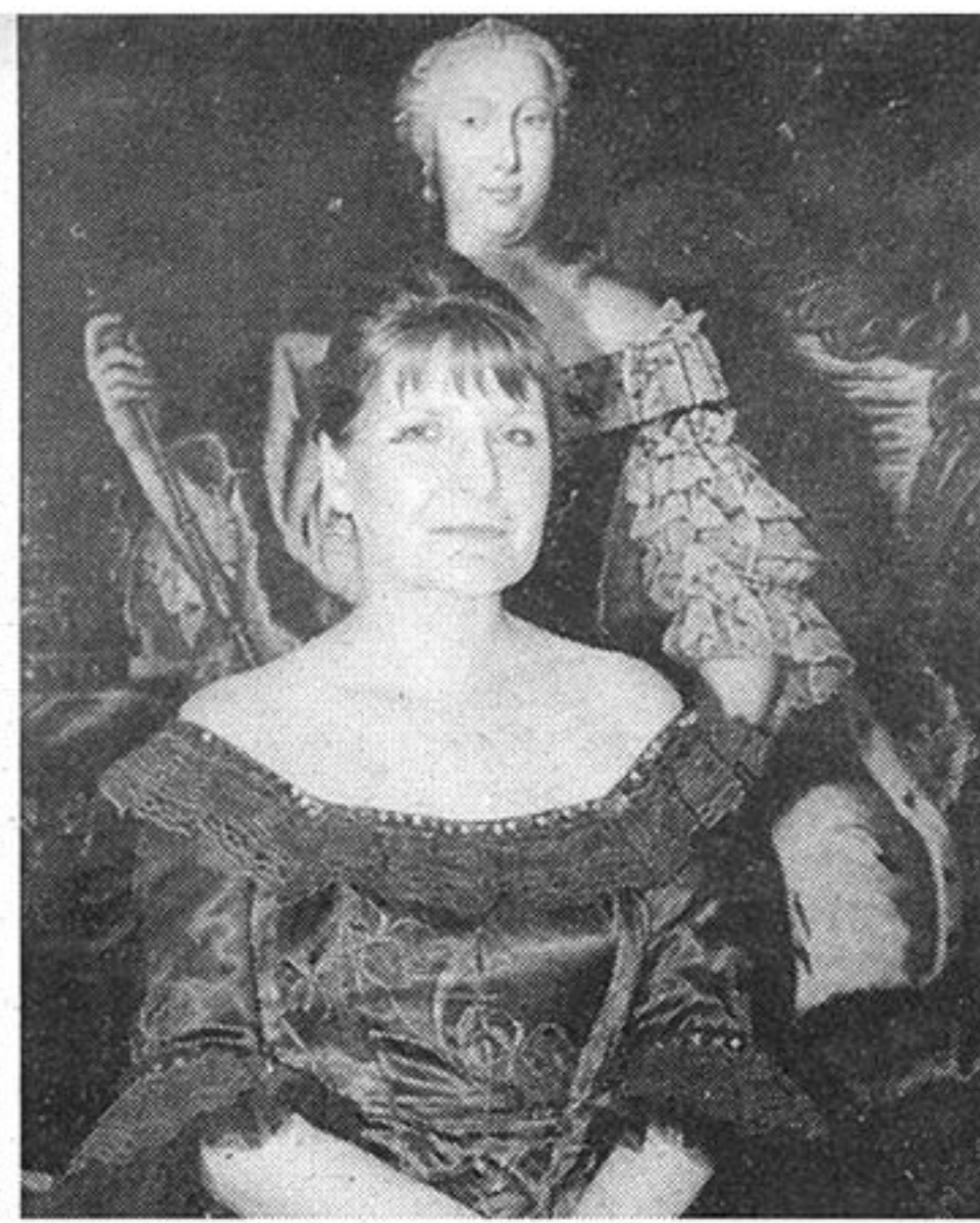
Carica Marija Terezija