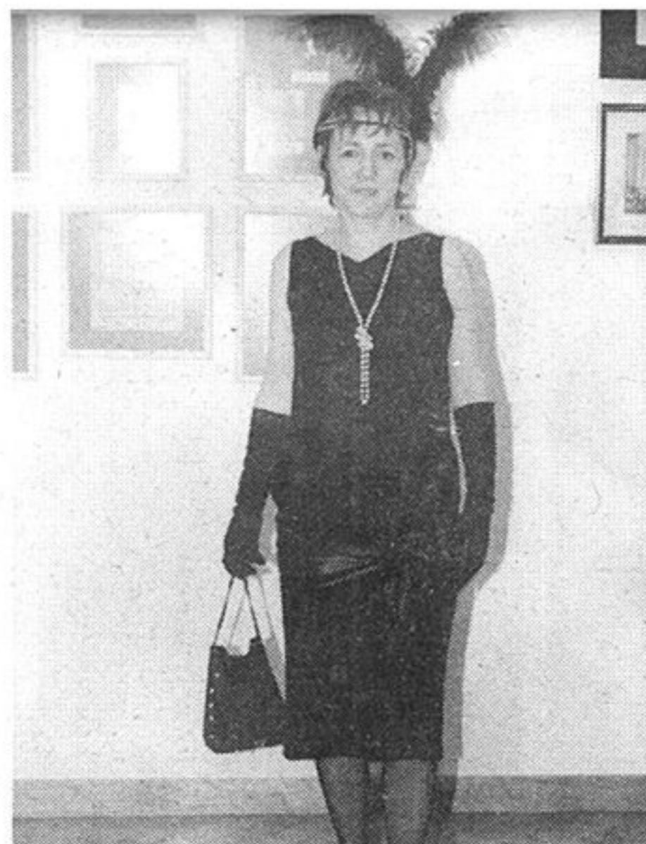
Dama koja je plesala čarleston

Žive slike nisu samo hodale Muzejom grada Zagreba. Mogli smo ih vidjeti i na Zagrebačkom velesajmu, gdje su, u paviljonu 8, pokraj maketa najljepših zagrebačkih zdanja, prošetali August Šenoa, koji je sve goste proveo po Zagrebu, coprnjice s Griča koje su proricale sudbinu, Krapinski pračovjek u društvu sv. Nikole i