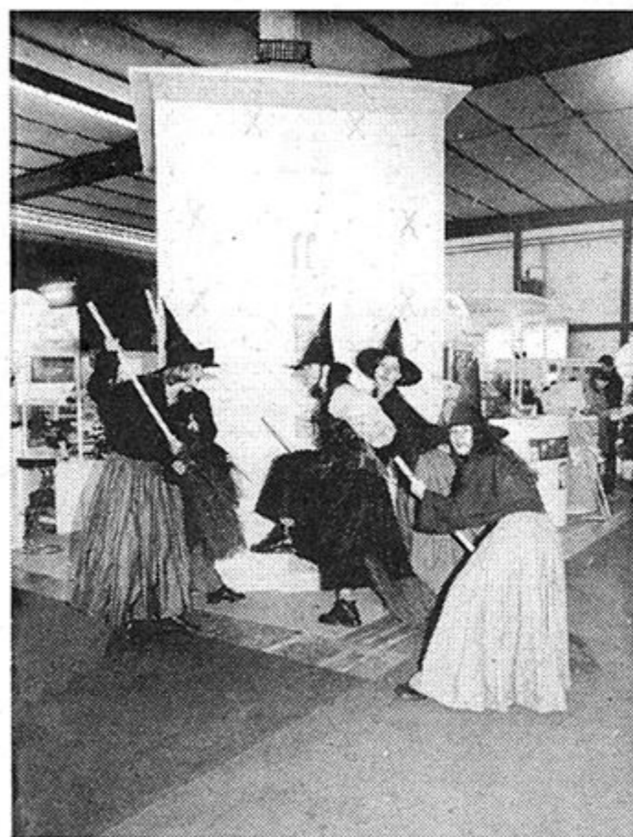
Gričke coprnjice iz Studija za suvremeni ples