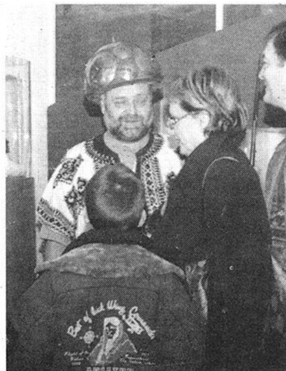
Brončano doba

krapinskog suca, dama u krinolinama i mnogi drugi.