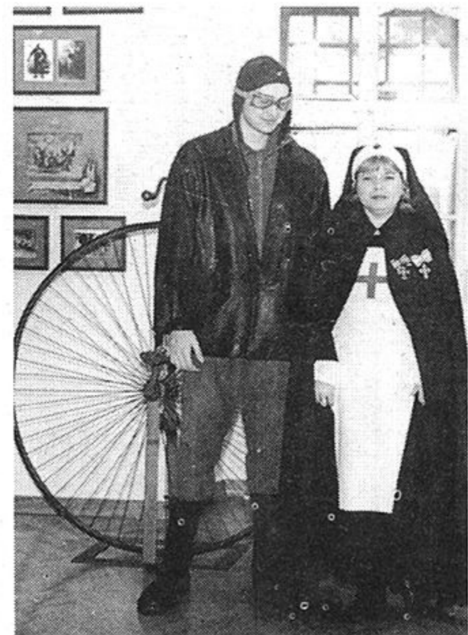
Medicinska sestra i avijatičar iz prvog svjetskog rata