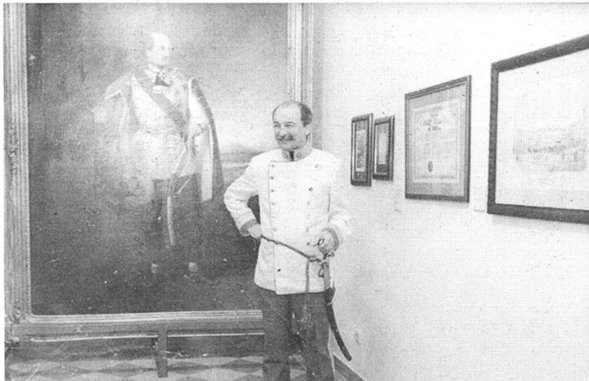
Ban Josip Jelačić