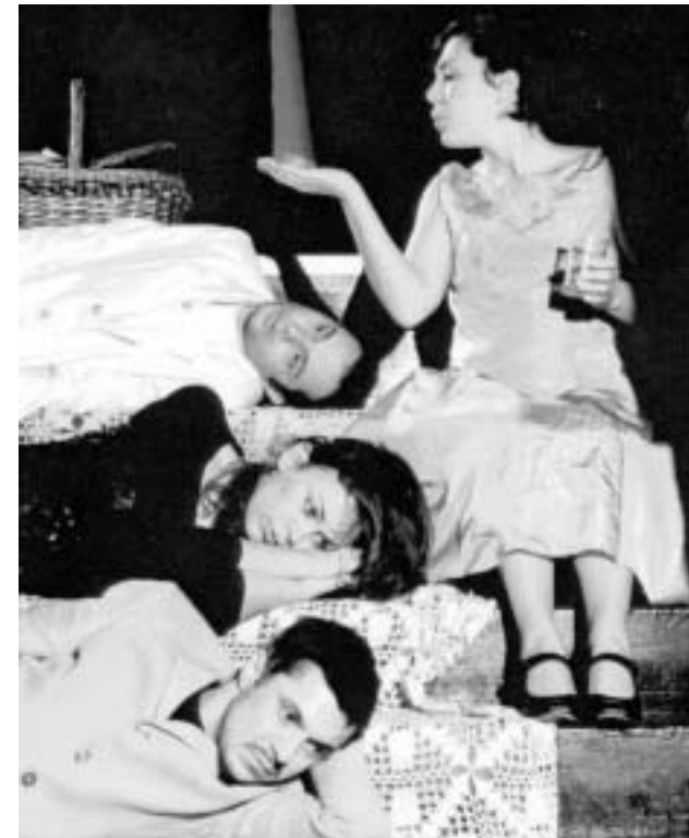
Prizor iz predstave

Osim Bernhardovih priopćenja, koje su tek povod da se ispriča vlastita priča, svoja mlika, u predstavi se »koristi istinita poslijeratna bilješka koja govori o susretu i sučeljavanju četiri čovjeka na pikniku gdje se razotkrivaju njihove funkcije u ratu (od zločinca do žrtve). Ta bilješka postaje i okvir Bernhardovim izabranim pričama«. Tu presjaje ono što je možda nužno znati, ali što ne čini predstavu, što ne jamči njezinu un-