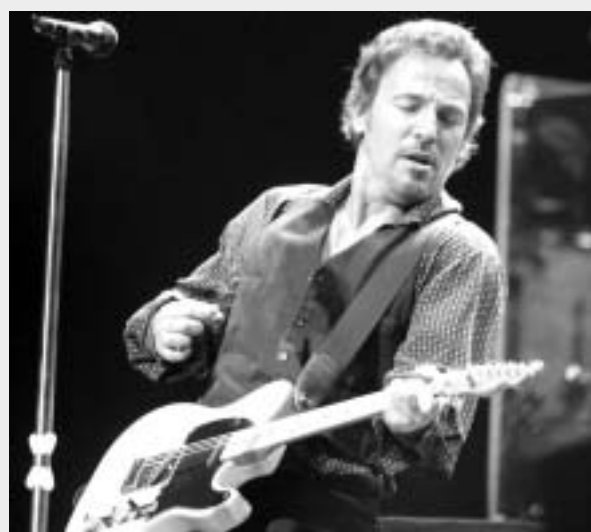
Aroma iračke traume: Bruce Springsteen

No, iako je Grammy podržao ideju da patriotizam ništa ne znači i odsutnost kritike vlasti, ipak je u Los Angelesu nedostajao zajednički nastup Dixie Chicks, Springsteena i Younga.