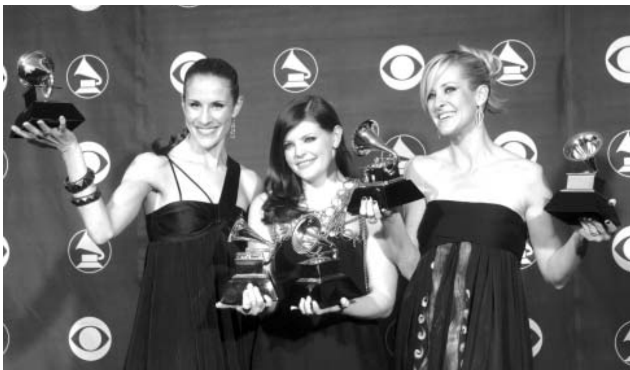
Pet nagrada Grammy kao podrška glazbene industrije susjedama Georgea W. Busha: Dixie Chicks

PRIZNANJA Nakon 49. dodjele američkih glazbenih nagrada