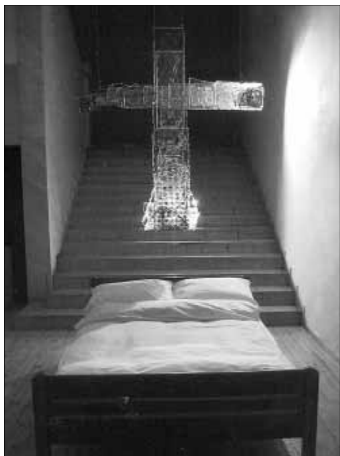
Osjećajni kodovi: Instalacija Tanje Bezjak u »Karasu«

Tanja Bezjak svojim instalacijama pomiruje kategorije osobnoga i javnoga (ulaz u galerijsku spavaonicu iz Praške ulice), dokazujući nepostojanje granice u umjetnosti i njezinu tumačenju života.