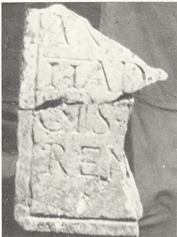
Muzej Slavonije, Osijek, inv. br. 7419

Prilikom kopanja usjeka za novu cestu na donjogradskom Pristaništu, na sjevernom kraju Miljanovićeve ulice, nađena su prošle godine i dva ulomka nadgrobnog spomenika iz rimskog doba. Nađeni su slučajno i ne istovremeno, na maloj udaljenosti jedan od drugoga, i to u najgornjem sloju koji je tu nasut razmjerno nedavno, a dopremljen je negdje iz donjeg grada.