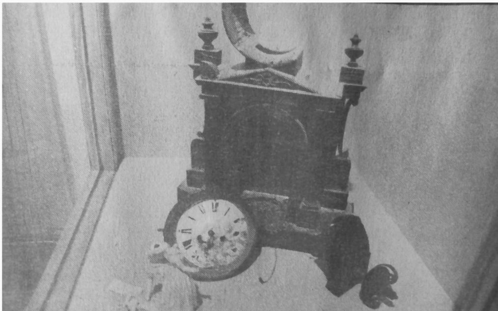
Vrijeme je stalo na bidermeyerskom satu i za obezglavljeni plesni par

A tu su i svjedočanstva današnjice: krhotine bombi i geleri što su oštetili kuće i njihovu opremu, prozorske okvire i vrata koji su tu izloženi u istrgnutim fragmentima. Pokoja kineska vaza ili tanjur raskomadani u djeliće na kojima su razneseni maleni likovi koje je davno islikala ruka s Dalekog Istoka. Upravo tako iskidane su duše postradalih ljudi u ovom bezumnom ratu. Ova izložba isječak je tih velikih razaranja u kome je Zagreb tek djelić razorenog mozaika Hrvatske.