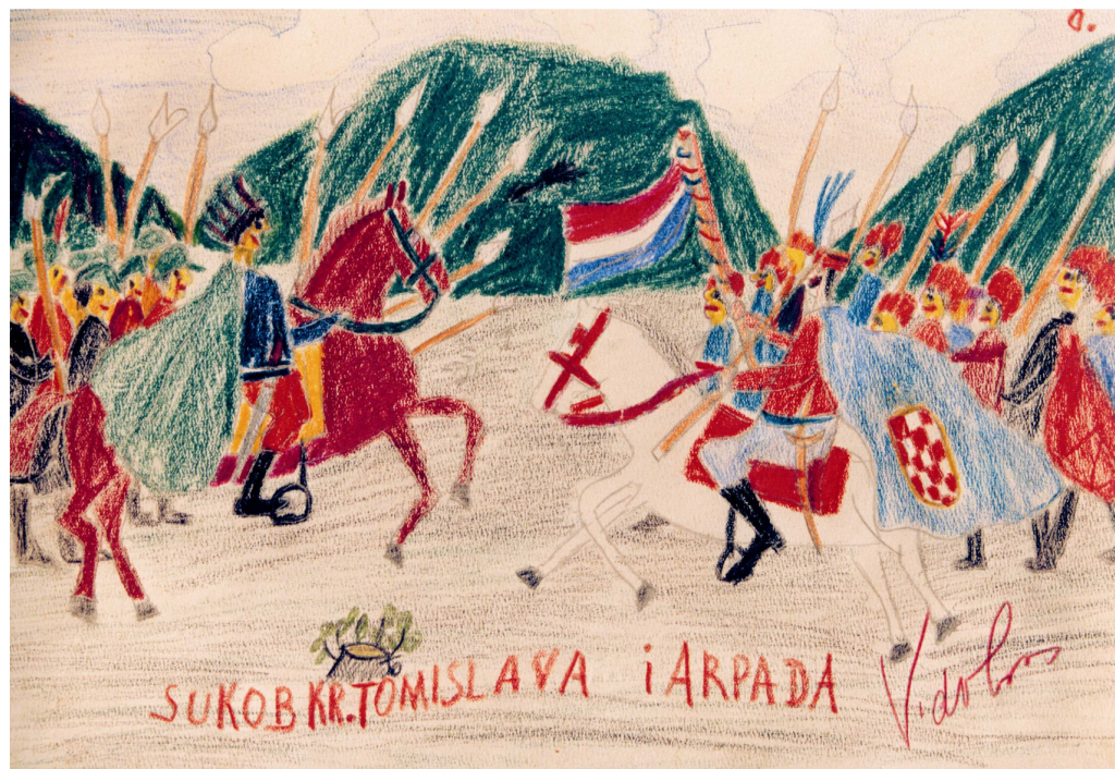
Državna mješovita pučka škola Kaptol učenički rad, III.a razred, Zagreb, 1930.god., DAZ sign. 20233