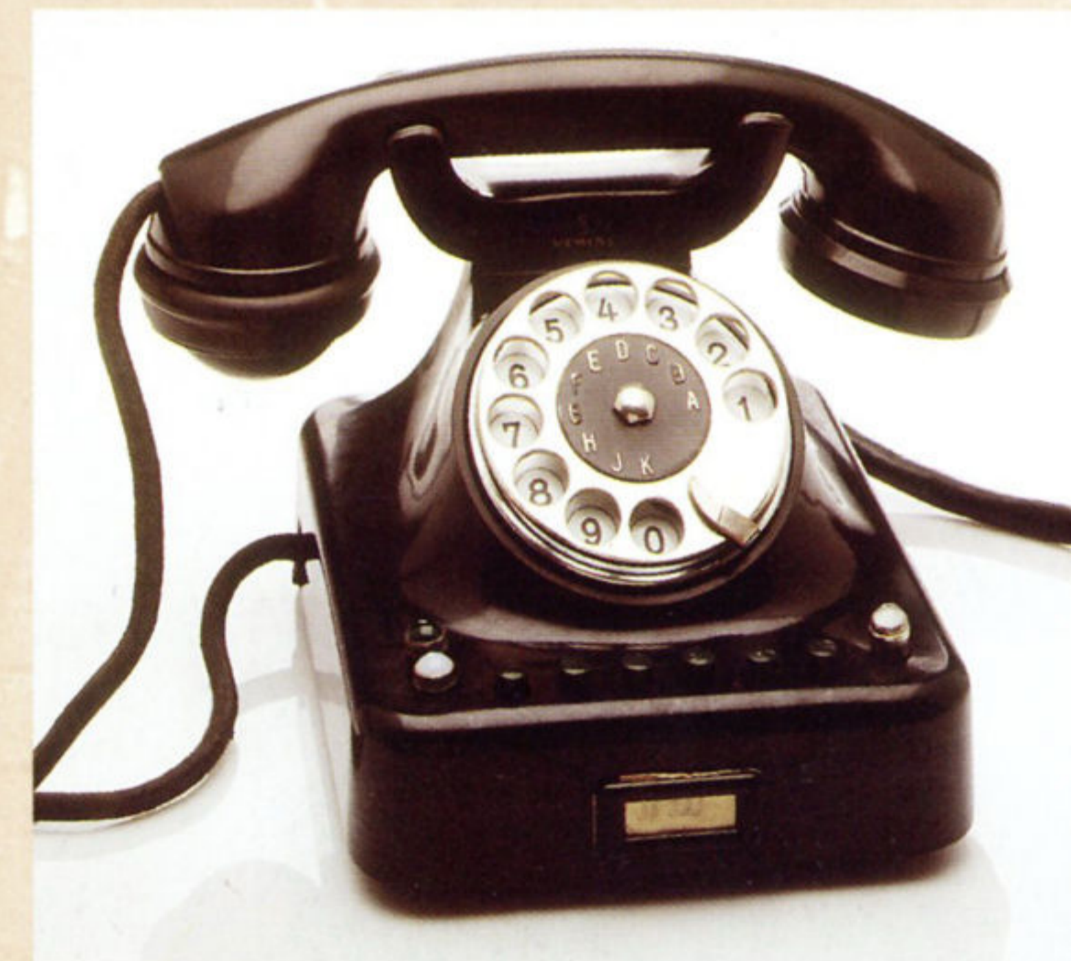
stolni serijski telefon Siemens, Zagreb, 1936. godine.

Muzej grada Zagreba, Opatička 20 15. travnja do 16. svibnja 1999. godine.