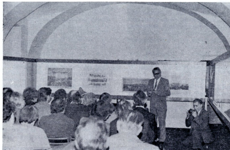
Sa simpozija o zagrebačkoj kovnici