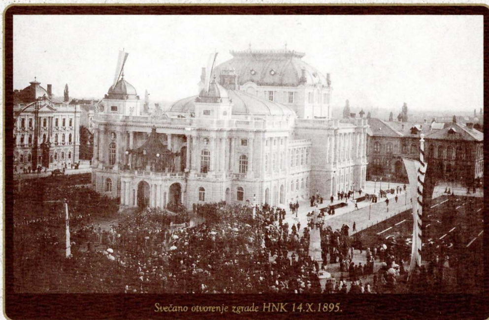
Svečano otvorenje zgrade HNK 14.X.1895.

ustavljivim hodom, uz različite oscilacije i kvalitete. Prvi značajni rezultati u tom smjeru bili su uzdignuće Zagrebačke biskupije na čast Nadbiskupije (kojoj su bile podređene tri sufraganske biskupije u zemlji), te spajanje dotadašnjeg kraljevskog grada i biskupske jurisdikcije u jedinstveni glavni grad Zagreb. Grad odatad ima izabranu gradsku upravu i gradonačelnika koji se autonomno posvećuju općoj modernizaciji grada i koja svoj uspon došije u posljednjim desetljećima 19. stoljeća. Grad dobiva moderno uređene ulice, plinsku a potom i električnu rasvjetu, vodovod, lijepo uređene parkove, moderno groblje »Mirogoj«, te gradske (tramvaj) i međunarodne prometnice (željeznice i dva glavna kolodvora). U ostalim hrvatskim gradovima procesi opće urbanizacije događaju se različitim intenzitetom i kvalitetom.