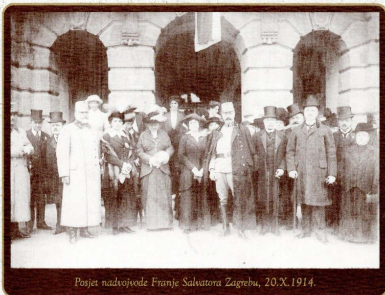
Posjet nadvojvode Franje Salvatora Zagrebu, 20.X.1914.