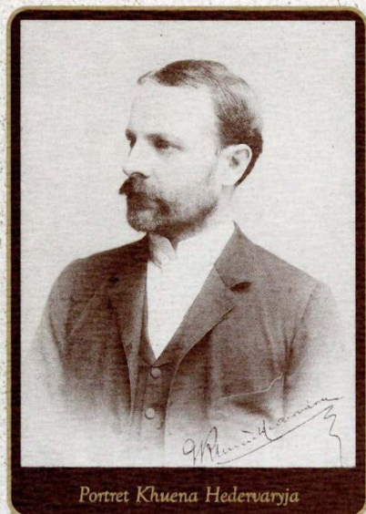
Portret Khuena Hedervarja

U Zagrebu, glavnom gradu Trojedne Kraljevine smještene su središnje nacionalne političke, privredne i kulturne institucije. U njemu stoluje ban (potkralj) u Hrvatskoj; Hrvatski Sabor (parlament) koji je službeni predstavnik hrvatske državno-pravne individualnosti te Zemaljska vlada i Vrhovno sudište (Stol Sedmorice). Tu su i najvažnije središnje kulturne i znanstvene ustanove: Hrvatska akademija znanosti i umjetnosti (utemeljena 1866. godine), Sveučilište (1874.), Hrvatski glazbeni zavod (1861.), Hrvatsko narodno kazalište (1846., moderna zgrada je podignuta 1895.), nadalje Matica hrvatska (1842.), Književno društvo sv. Jeronima (1868.), Hrvatsko-pedagoški književni zbor (1871.), Hrvatski liječnički zbor (1874.), Hrvatsko arheološko društvo (1878.), Hrvatsko pravničko društvo (1875.), Narodni muzej (1846.), Strossmayerova galerija starih majstora (1884.), Muzej grada Zagreba (1907.) i još brojne slične ustanove, stranačko novinstvo te tiskare i knjižare.