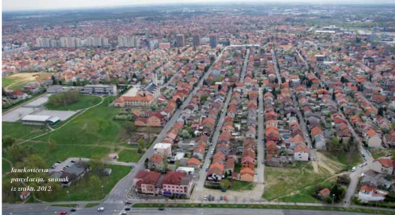
Janekovićeve parcelacija, snimak iz zraka, 2012.