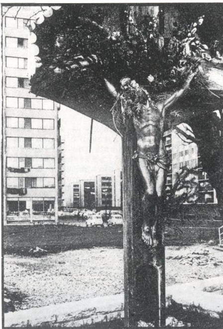
Stanko Vrtovec: Bez naslova I (jedna od nagrada)

Nakon ovih nekoliko uvodnih riječi započeti prikaz o izložbi tvrdnjom da posjetilac vidi i doživljava one 74 izložbene fotografije, koje su prošle kroz filter izbora, da bi se među 360 prispjelih fotografija izdvojile i u nekom smislenom redu svrstale na izložbenim panoima, dovodi nas u položaj prosudbe kvalitete i cjelovitosti ponudene nam izbora. Jer u ocjenu kriterija odabira teško je ući s obzirom na to da ne znamo što je on odbacio prezentirajući nam svoj pogled na fotografiju i Zagreb u njoj.