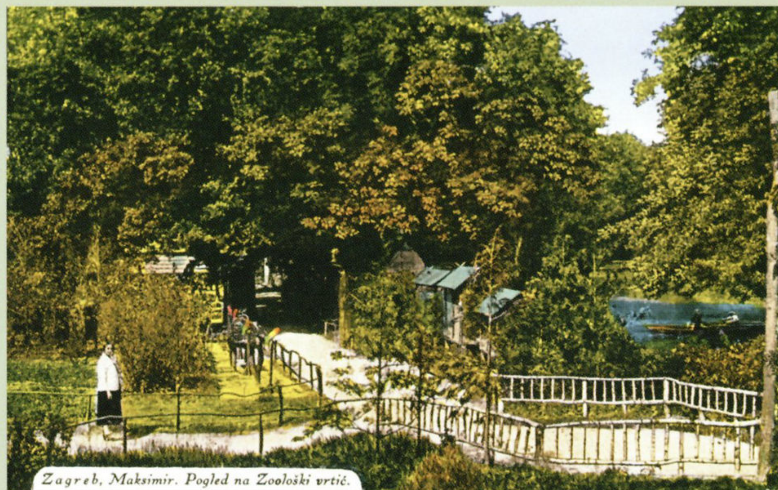
Zagreb, Maksimir. Pogled na Zoološki vrtić.