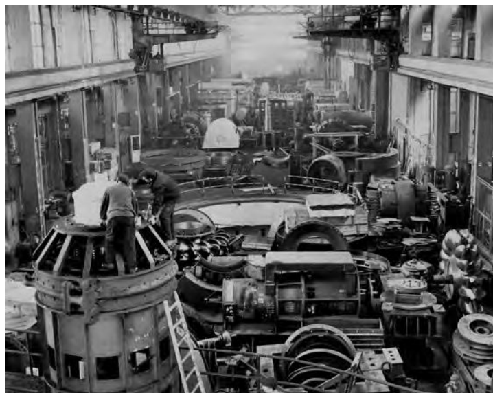
Interijer tvornice Rade Končar, presnimka fotografije, Zagreb, 1954.