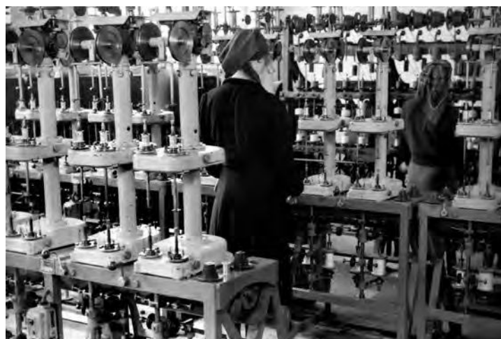
Detalj iz odjela namatanja žice tvornice ELKA, presnimka fotografije, Zagreb, 1954.