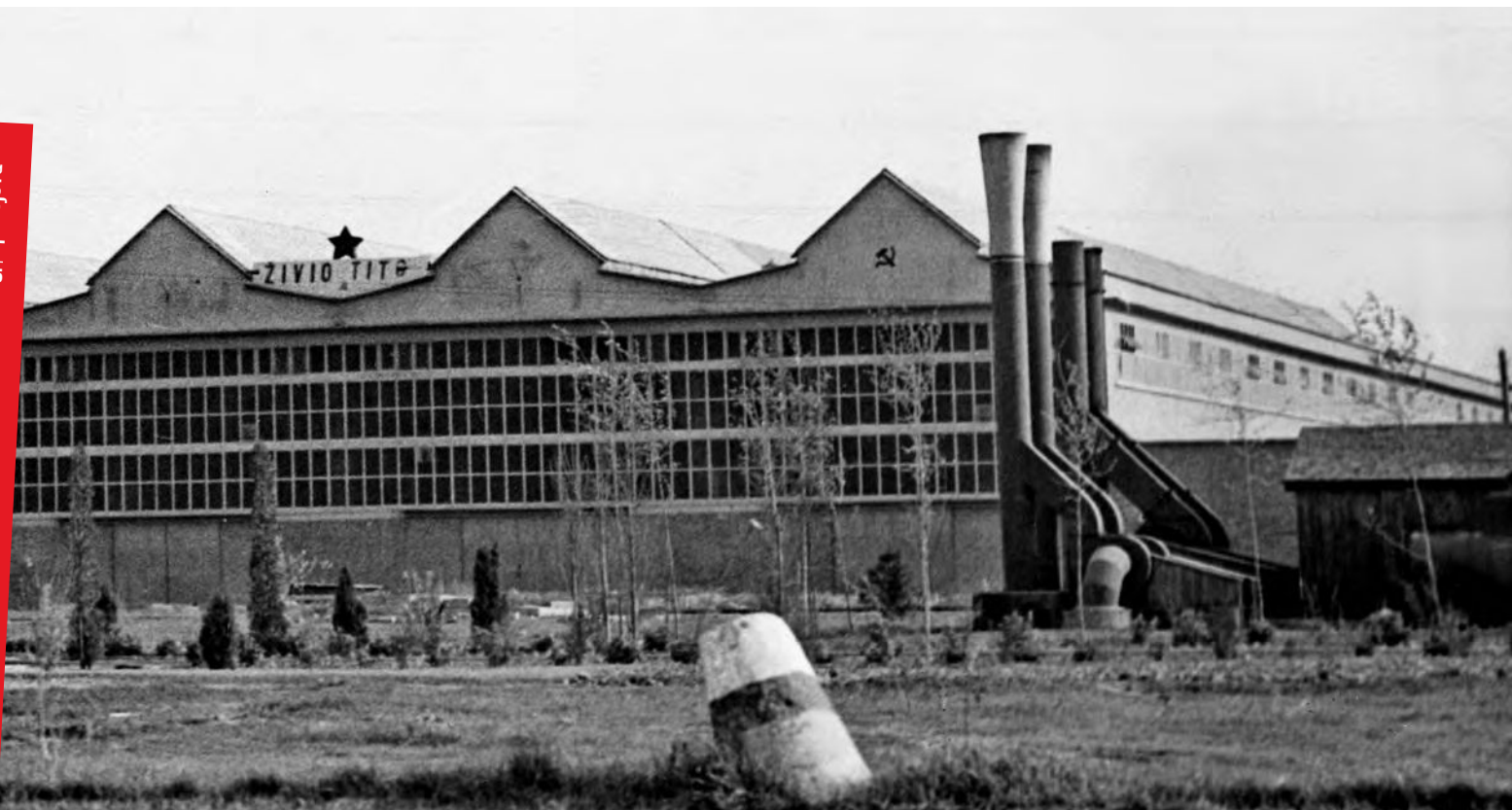
Zgrada uprave i glavna hala tvornice Jedinstvo , presnimka fotografije, Zagreb, 1954.

reviziju Petogodišnjeg plana. Investicije su usmjerene prema obrani i dovršetku izgradnje industrijskih sklopova od saveznog značaja, a rok za okončanje Plana pomaknut je na 1952. godinu. Zaokret 1948. godine utjecao je na prioritete i tempo provedbe Petogodišnjeg plana, što se odrazilo izmjenama proizvodnih programa državnih poduzeća. Izmjene programa proizvodnje utjecale su na preinake projekata industrijskih sklopova u različitim fazama izgradnje. Tek je dio sklopova bio dovršen prema izvornim zamislama projekatana. Većina je pretrpjela preinake, pri čemu je izgradnja pojedinih pogona i objekata nerijetko prolongirana, a ponekad i posve odbačena novim planovima. Odras vanjskopolitičkog preokreta 1948. godine na industrijalizaciju bio je najizazovniji dio pri izradi scenarija izložbe. Zbog ograničenog prostora na izložbi je prezentiran tek dio informacija o utjecaju tog prevratnog događaja na proces izgradnje industrijskih sklopova. Više informacija iznijet ću u finalnoj publikaciji projekta Zagrebačka industrijska baština: povijest, stanje, perspektive .