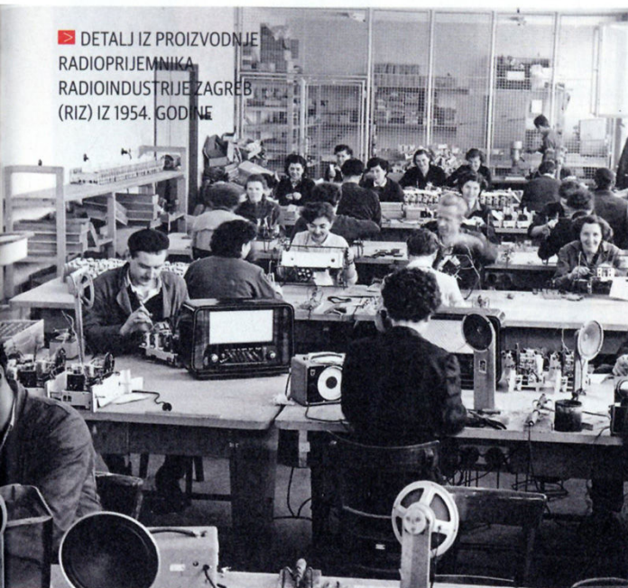
▶ DETALJ IZ PROIZVODNJE RADIOPRIJEMNIKA RADIOINDUSTRIJE ZAGREB (RIZ) IZ 1954. GODINE