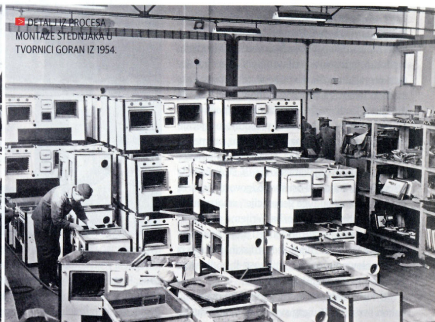
▶ DETALJ IZ PROCESA MONTAZE ŠTEDNJAKA U TVORNICI GORAN IZ 1954.