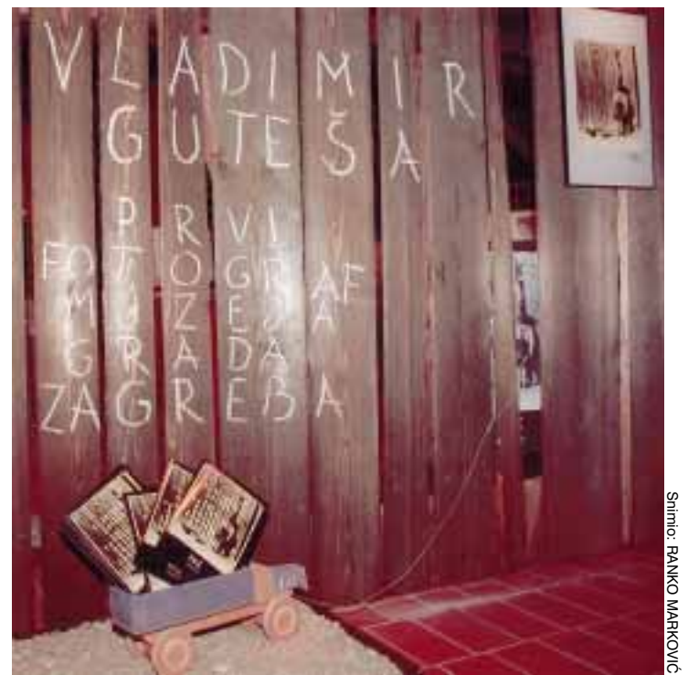
Fotografija »Znatiželja« iz 1937. poslužila je autorima kao ideja za ulaznu instalaciju izložbe fotografija Vladimira Guteše