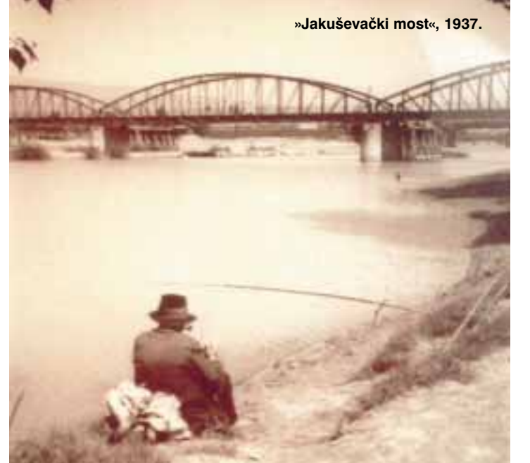
»Jakuševački most«, 1937.

zahvaljujući mom trudu, barem malo uživanja i ljepote kojima se i sam nadam. Nije to samo nada, već i vjera u čudno lijepo, a bez koje bih osjećao samo silan strah od mogućeg nanošenja gubitka osobi