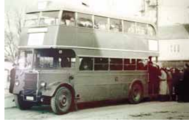
»Autobus Črnomer-Podused«, 1955.

U ponedjeljak se u Multimedijalnoj dvorani Muzeja grada Zagreba otvara izložba fotografija Vladimira Guteše / Njegove fotografije mnogobrojnim stručnjacima i danas predstavljaju izvanrednu podlogu za izučavanje prošlosti Zagreba