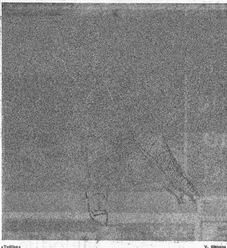
• Povratak •

U posljednja smo vremena u izložbenoj politici retrospektivno raspolažati: zadnjih dana sezona vidjeli smo izložbe Lea Juneka, Bacića, Gecana... I teško je sada odgovoriti otkud ta nostalgija za »staracima«? Nije je stvaralačka mladost pripadala drugom i trećem desetljeću ovog stoljeća. Ali oni su sada ponovo među nama i još uvijek nam bogate darove donose. Povratak, kao Vilko Gecan, iz tajnih, skrivenih razlika.