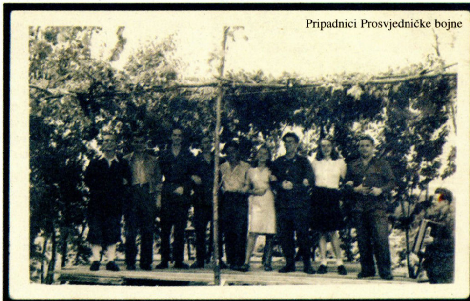
Pripadnici Prosvjetničke bojne