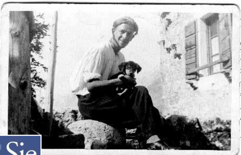
Ispred rodne kuće 1931.

Odgovorni profesionalac U svim razdobljima života, koliko su dopuštale okolnosti, radio je i pisao sustavno, s istom vatrom ishodišnog nadahnuća svojega užeg i šireg zavičaja. Cijelo njegovo društveno djelovanje i pedagoška karijera služili su bez prekida i jedino glavnom pozivu skladatelja, iako je angažirano »vanjsko« djelovanje ostavljalo suprotan dojam. Imao je rijetku osobinu odgovornosti prema dogovorenim rokovima bez obzira na što su se odnosili i vrlo bolno mu je padala težnost kojom se okolina odnosila