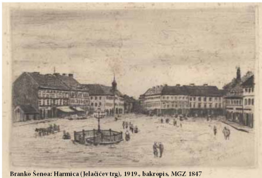
Branko Šenoa: Harmica (Jelačićev trg), 1919., bakropis, MGZ 1847