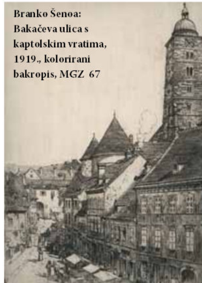
Branko Šenoa: Bakačeva ulica s kaptolskim vratima, 1919., kolorirani bakropis, MGZ 67

Katkada se Šenoa služi i starijim likovnim predloškom, kao što je vjerojatno slučaj kod staroga Griča, gdje bilježi sva-