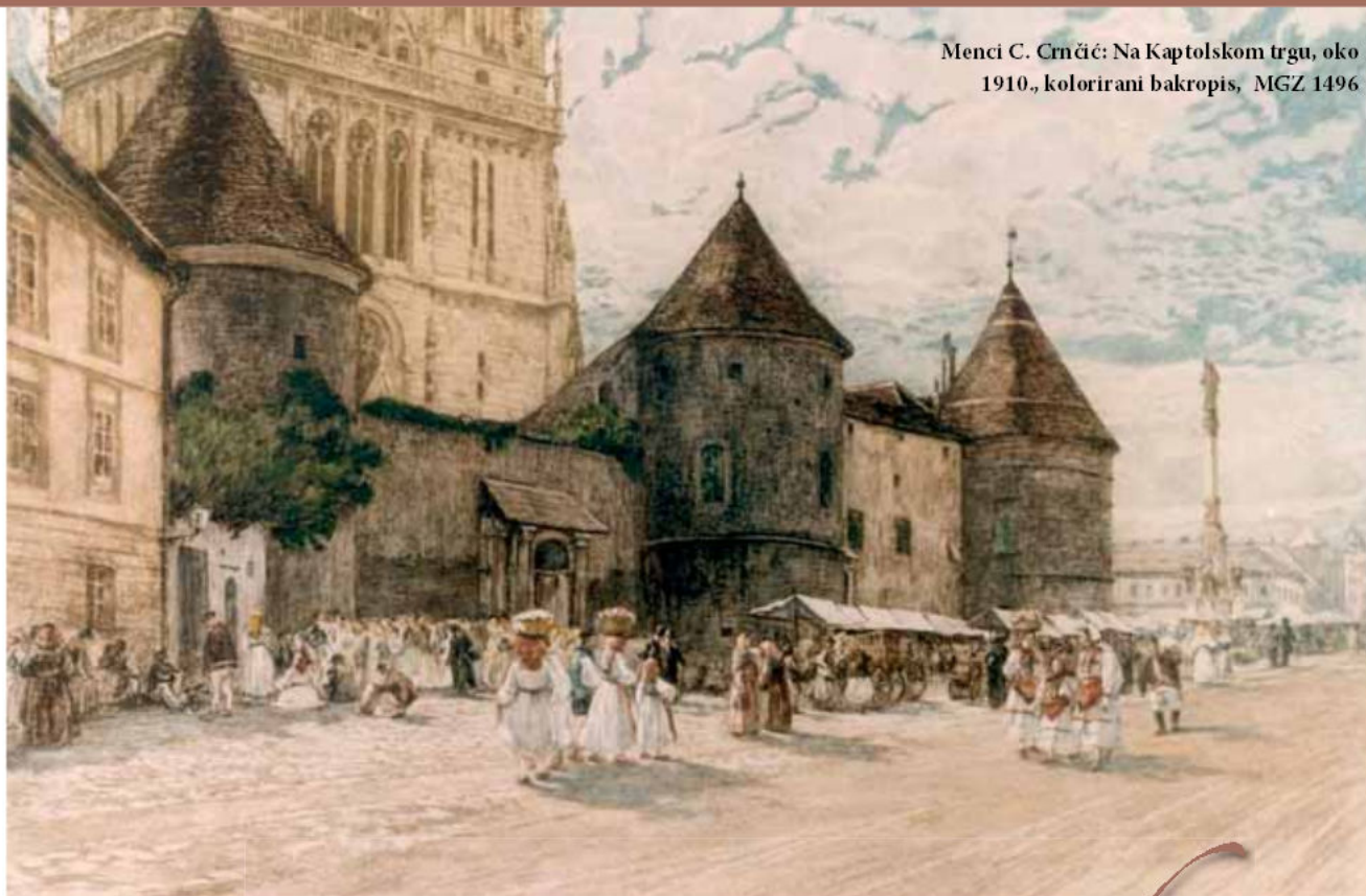
Menci C. Crnčić: Na Kaptolskom trgu, oko 1910., kolorirani bakropis, MGZ 1496