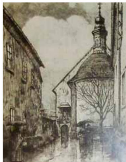
Branko Šenoa: Crkva sv. Marije na Dolcu, 1917., zeleno tonirani bakropis, MGZ 71