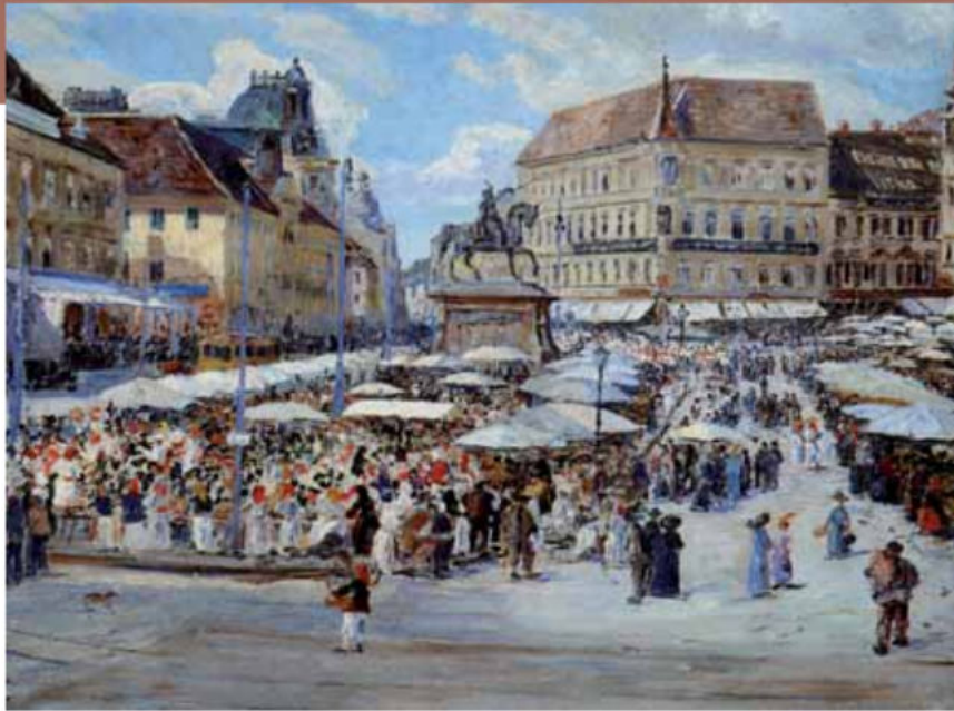
Menci C. Crnčić: Jelačićev trg, 1911., ulje na platnu, privatno vlasništvo