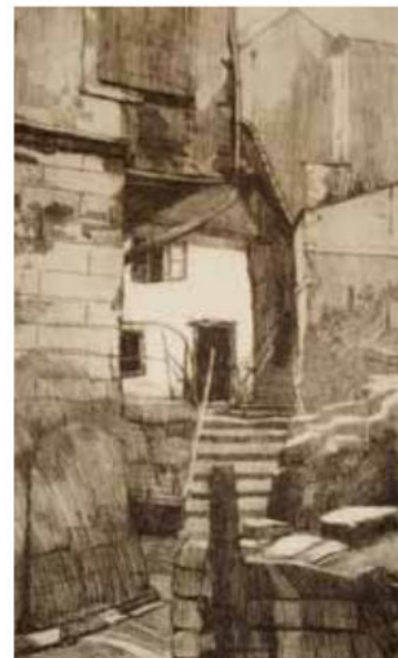
Vjera Bojničić: Kožarska ulica, 1917., bakropis, MGZ 4526

Proučavao je naše krajolike, prikazivao ih na grafičkim listovima, a 1907. u Beču je izdao mapu bakropisa: skice i dojmovi iz Dalmacije, Bosne, Hrvatskog zagorja i Beča. Osim egzotike, Krizman se u svojim putopisima obilno bavio motivima našega mora, Zagorja i Zagreba, piše Smiljka Domac Ceraj u katalogu retrospektivne izložbe koja je održana u Umjetničkom paviljonu 1995., točno četiri desetljeća nakon smrti ovog velikog grafičara. Zagrebačke je vedute, osim u grafici, bilježio najčešće u akvarelu. Najrašireniji su njegovi bakropisi iz ciklusa Stari Zagreb iz 1917., primjerice veduta s početka današnje Tkalčićeve (isti motiv koji je nekoliko godina ranije naslikao i M. C. Crnčić) te veduta današnje Tomićeve ulice s uspinjačom. Te grafike često su krasile zagrebačke građanske domove. U bogatom