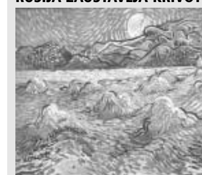
Krivotvoreni Van Gogh

■ MOSKVA – Ruski stručnjaci ovih se dana pripremaju za bitku s rastućim brojem vješto izrađenih krivotvorina, formirajući pritom ceh stručnjaka za umjetnost. Cilj te udruge jest donošenje standarda za potvrdu autentičnosti umjetničkih djela. Planira se dodjeljivanje licencij stručnjacima s različitim područja umjetnosti, koji će pružiti informaciju i pravnu pomoć kolekcionarima. [M. K.]