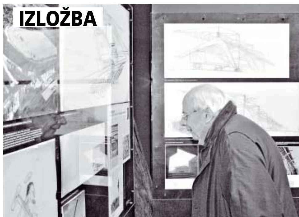
Rijetko viđeni vrhunski crteži: S otvorenja izložbe