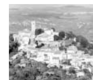
Nužna obnova motovunskih zidina

Jedan od najsvetacnijih trenutaka Sajma bit će pak dodjela Nagrade za europsko razumijevanje koja ove godine pripada ukrajinskome pjesniku i prozaiku Juriju Andruhoviću.