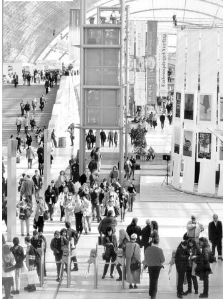
Jedna od najposjećenijih knjižnih smotri na svijetu: Leipziški sajam