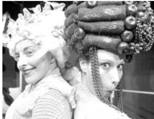
Prizor iz splitske predstave

»Te su laži zavodljive, šarene i zabavne pa se s nji-