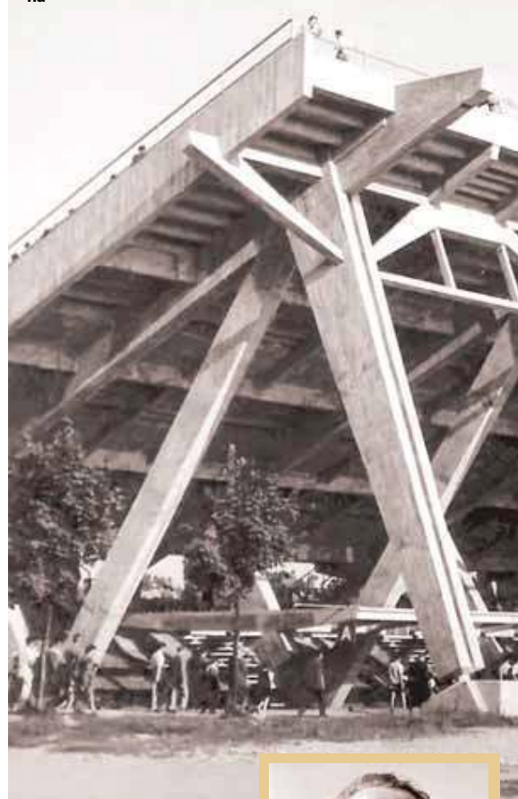
Zapadna tribina Dinamova stadiona

Za Turinin duhovni svjetonazor važno je spomenuti da se u bijegu od ratne svakodnevice posvetio prevodilaštvu. Prijevod knjige Emila Couea »Odgoj ličnosti svjesnom autosugestijom«, inspirirane Freudovom metodom psihanalize, pozicionirao ga je u nesvakidašnji kontekst u kojem je dominantna duhovna dimenzija. U kasnijim pismima prijateljima pokazuje bliskost ideji romana struje svijesti i francuskom novom valu te Godardovim punkoidnim sta-