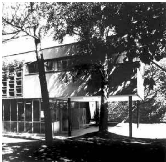
Centar za zaštitu majke i djeteta u Zagrebu (Klaićeva)