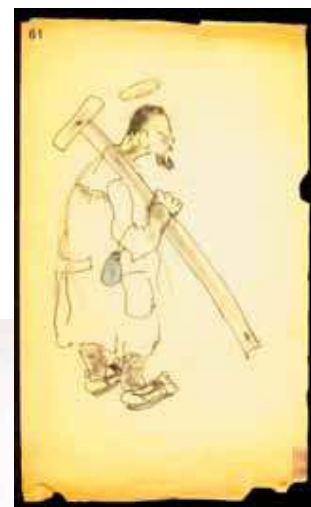
Arhitekt mučenik: Karikatura iz druge polovice četrdesetih godina prošlog stoljeća