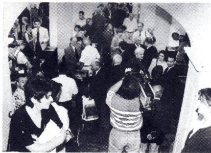
Izložba u Gradskom muzeju u Grazu privukla je kulturnjake iz svih devet prezentiranih gradova