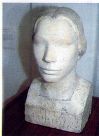
▲ Ernst Barlach: "Glava Tille Durieux", bijeli mramor.