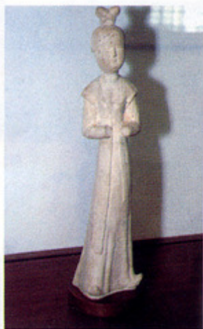
▲ Starokineska obredna posuda

Tekst Bosiljka Brajčić Pasarić