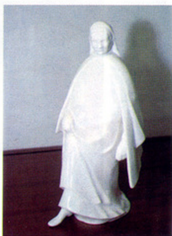
▲ Ernst Barlach: "Opatica", statueta u porculanu.