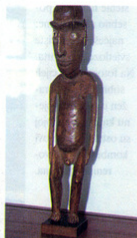
▲ Statueta idola s Uskršnjih otoka