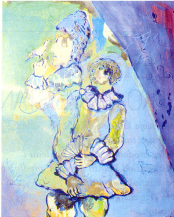
▲ Marc Chaghall: "Dama s pticom", gvaš.

Zbirku Tille Durieux nadopunjavale su i umjetnine u vlasništvu njezine prijateljice Zlate Lubienski kod koje je stanovala, pa je