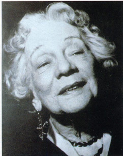
Tilla Durieux u kasnijoj život- noj dobi.