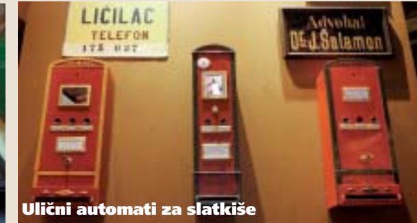
Ulični automati za slatkiše