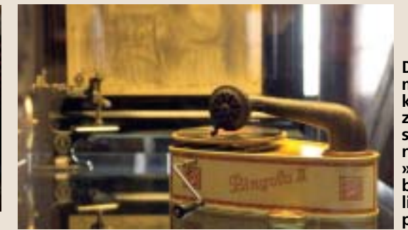
Dječji gramofon s kutijicom za igle i specijalnom »Penkala baby« veličinom ploča