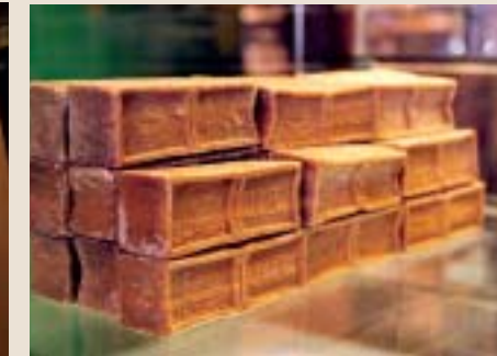
Sapuni iz ratnih zaliha