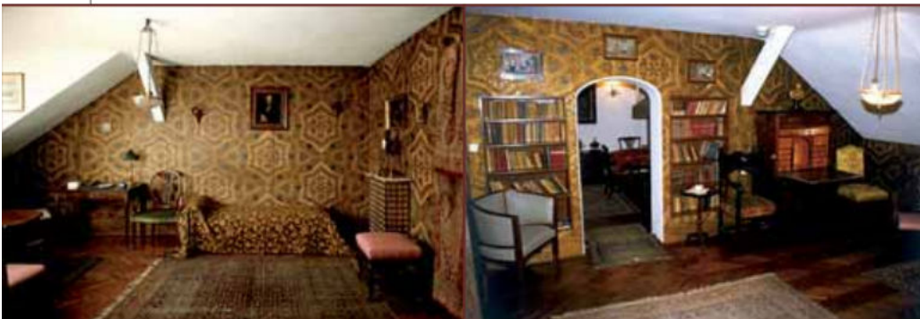
Salon, soba za razgovor, MGZ

Odjelio je strogo, hodnikom i posebnim ulazom sa stubišta, kuhinju s vjerovatno najmanjom djevojačkom sobom u