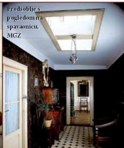
Predsoblje s pogledom na spavaonicu, MGZ

nišu ispod prozora iskoristio je za izlaganje različitih sitnica koje je kupovao na aukcijama ili kod antikvara, najviše na svojim čestim putovanjima u Beč. S jednog takvog putovanja donio je i veliku sliku "Mrtva priroda", nizozemskog slikara J. Hupina iz 17. stoljeća, koja ljepotom i živim tonalitetom razbija monokromiju toga prostora.