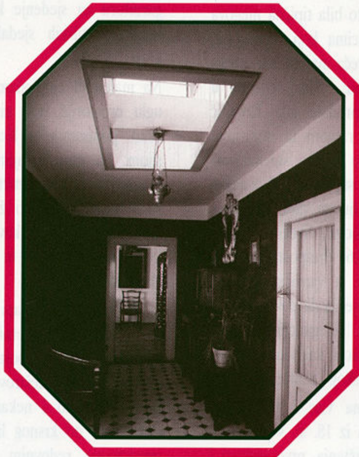
Zbirka Viktora Kovačića, Masarykova 18, Zagreb.

Loosovu "Inseln gesprochen", izdanu u Parizu 1921., u kojoj su sabrani Loosovi kritički članci i dojmovi s Bečkih izložaba od 1897. do 1900., koje je Kovačić vidio za vrijeme studija u Beču i o kojima je zacijelo i razgovarao s Loosom, 19 te nekoliko knjiga