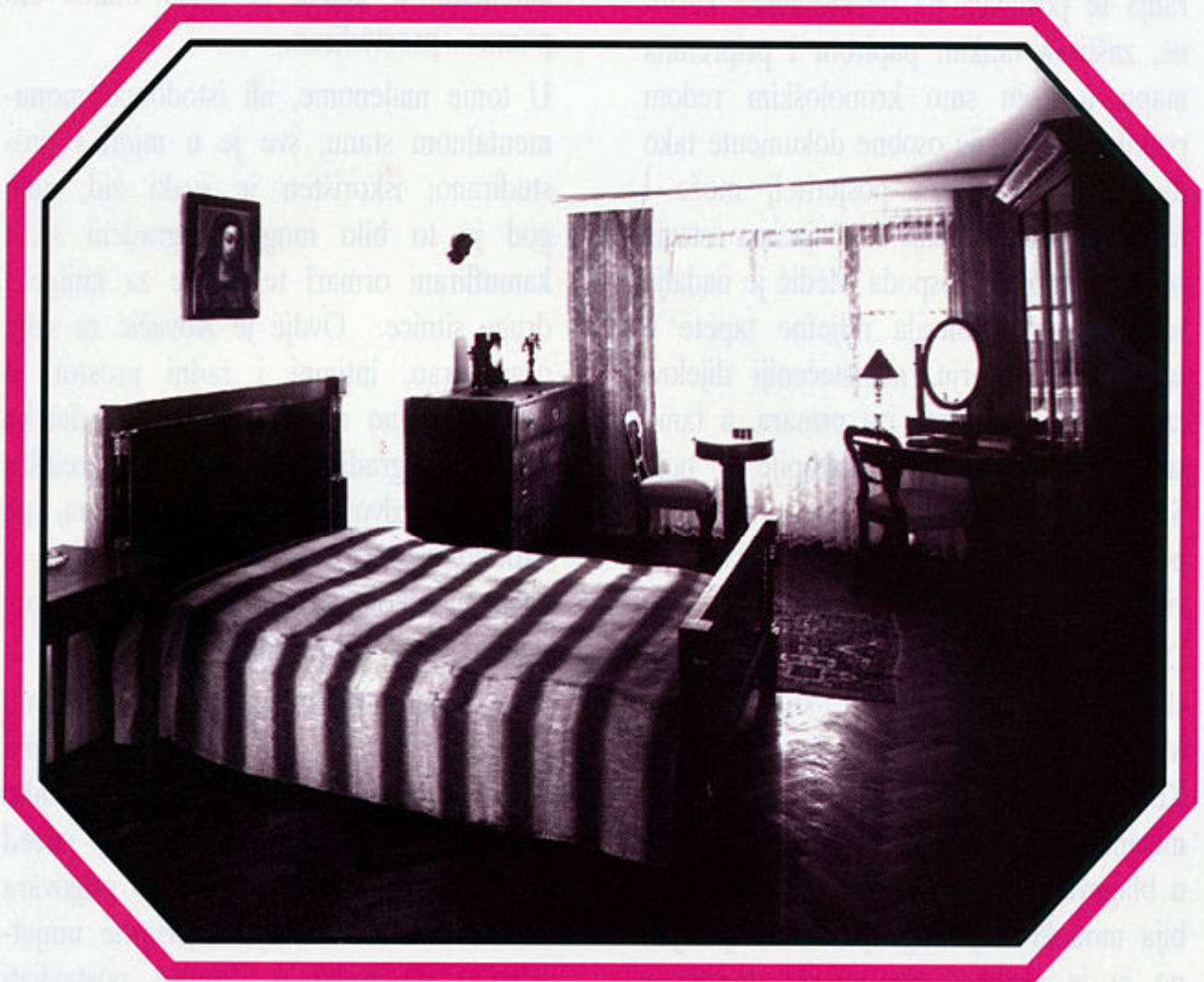
Zbirka Viktora Kovačića, spavaća soba.

delikatan posao na obnovi velikoga kašmirskog vunenog šala, koji u obliku zastora kamuflira vrata spavaće sobe, a koji svojom orijentalnom šarom stvara