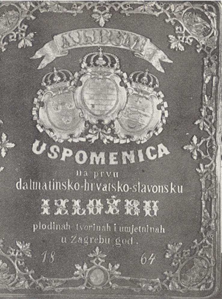
Album »Uspomenica« izdan povodom izložbe u Zagrebu 1864. godine

odjelu srećemo se s drvenim plugom, drljačom i drugim »gospodarstvenim oruđem«. Peta i najveća dvorana sadrži ostale »podrazrede«. Tu su izloženi: pokućstvo, kovna, staklena, i glinena roba, narodna gradska nošnja i vezivo, glazbala, tiskarski i knjigovežni proizvodi, učila i radovi učenika, »stari rukopisi i ine starine«, »slikarije, risarije, obrasci i kipotvorine«, »bakrorezi, kamenopisi i svjetlopiši« te napokon »Uspomenica«, odnosno album izdan povodom izložbe 1864. godine.