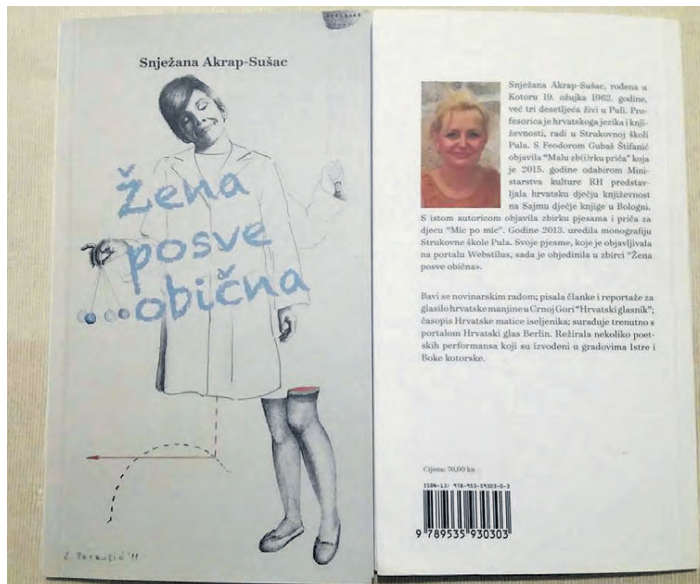
U knjizi, kao što to naslov sugerira, riječ je o jednoj posve (ne)običnoj ženi, koja voli, veseli se, tuguje, pati...

U nekim njezinim stihovima ima vrlo simpatične ironije, drugdje su prisutni solilokvij s dušom, intimističko poniranje u drevne svjetove duše, koji, baš poput u romantičara, što su udaljeniji to su zanimljiviji i lirski uzbudljiviji. Autorica donosi i pjesme narativnog karakte-