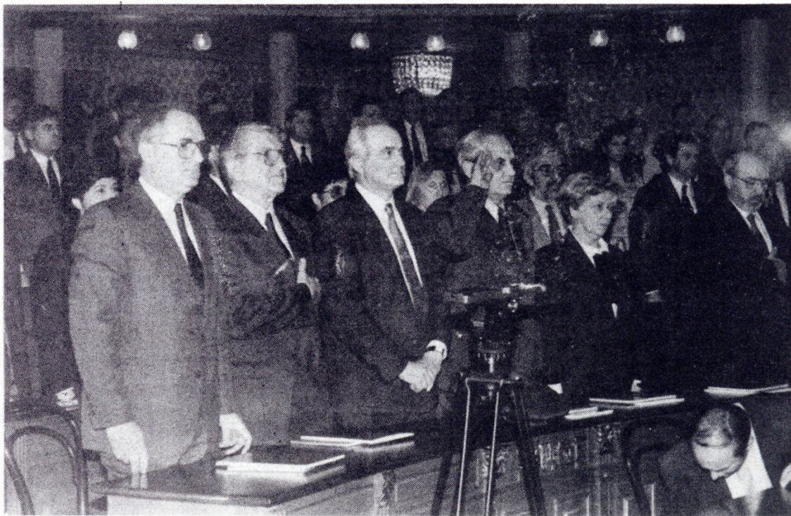
U prisutnosti visokih gradskih i republičkih uzvanika obilježena je 70-ta obljetnica Čistoće Zagreb

U svojem djelovanju koristi brojne interventne ekipe, moderne strojeve za pranje i čišćenje ulica, a u idućem razdoblju, naravno, ovisno o sredstvima – jer svima su nam znani teški