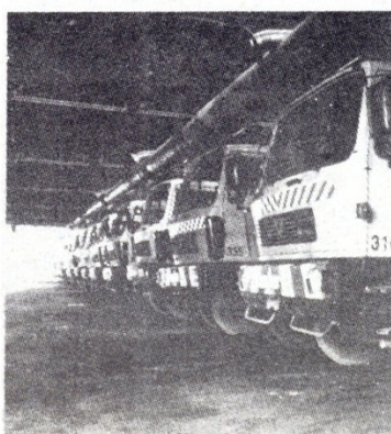
»Čistoća« danas – suvremeni vojni park