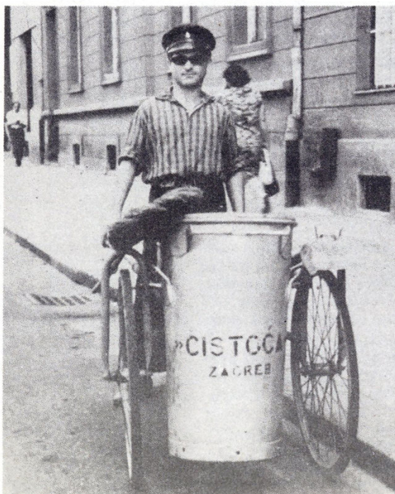
Čistač ulica s dvokolicom – početak 60-ih godina