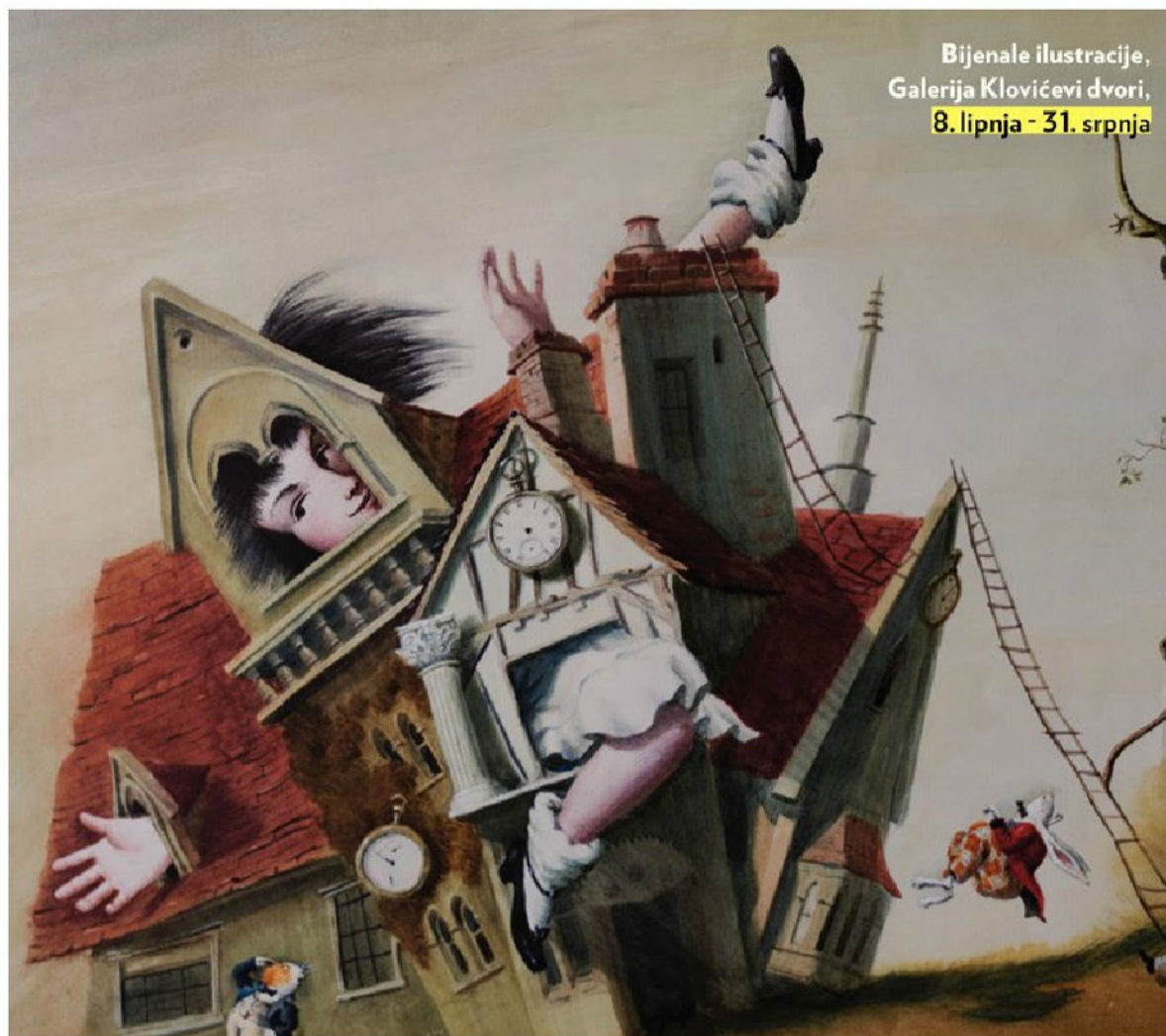
Bijenale ilustracije, Galerija Klovićevi dvori, 8. lipnja - 31. srpnja

Pjevala je na hrvatskom, njemačkom, engleskom. U operama, operetama i dramama Ruža Cvjetičanin nastupila je u osamdeset uloga, posebno u zlatno doba operete tridesetih godina prošlog stoljeća u Zagrebu, kada se priređivalo četiri do čak osam premijera u godini te su se igrale po dvije predstave nedjeljom i blagdanom, najčešće u zgradi Streljane na Tuškancu.