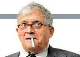
DAVID HOCKNEY slikar

Slikarstvo je umjetnost starih ljudi jer podrazumijeva akumulaciju stvari. Rekao sam to jednom Lucianu Freudu.