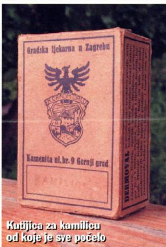
Kutijica za kamilicu od koje je sve počelo

Dijelove svoje kolekcije pokazao je na 14 izložaba, a od 16. srpnja u Muzeju grada Zagreba može se razgledati Zbirka stare ambalaže (2000 eksponata u dvije prostorije), njegov dar, odsad stalan postav muzeja. Pozivnicu za otvorenje poslao je i predsjedniku Stjepanu Mesiću, koji mu se prije pet godina u Radićevoj ulici, dok je bio sagnut nad hrpom odbačenih predmeta, obratio s "Gospodine, što to radite?" Rodin mu je pričao o svojoj skupljačkoj strasti spomenuvši da je i doktorirao na razvoju ambalaže i tehnologiji pakiranja.