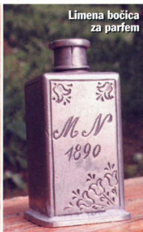
Limena bočica za parfem

Napisala Jagoda Zamoda