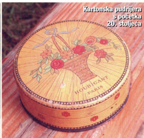
Kartonska pudrjera s početka 20. stoljeća