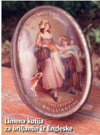
Limena kutija za briljantni iz Engleske