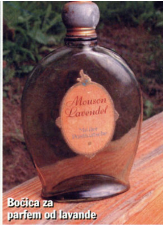
Bočica za parfem od lavande