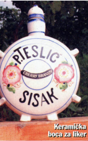
Keramička boca za liker