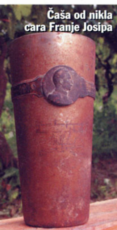
Čaša od nikla cara Franje Josipa

Zagrebački kemičar, skupljajući 30 godina staru ambalažu stvorio je zbirku od 9000 predmeta, čiji je dio darovao Muzeju grada Zagreba, a na svom je hobiju i doktorirao