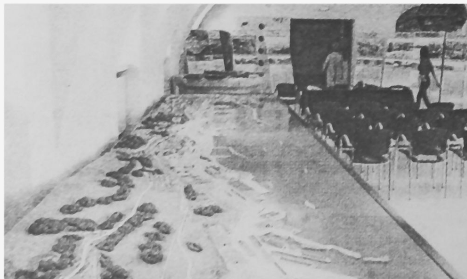
Maketa riječke luke

pa do današnjih dana. U podnim vitrinama izloženi su predmeti iz lučkog bazena te neki od materijala kojima se trgovalo u luci. U postavu, pak, dominira, velika maketa luke i grada s početka prošlog stoljeća, kada je Rijeka bila među deset vodećih luka u Europi.