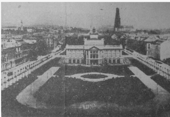
Dva pogleda na Zagreb u razmaku od samo 18 godina! Fotografije su snimljene s istog mjesta gdje je današnji Glavni kolodvor – gornja 1880. godine, donja 1898.

Počinja se razmišljati o regulaciji i proširenju grada, pa se već 1883. bira regulatorni odbor, a 1887. Gradsko poglavarstvo prihvaća njegov prijedlog regulacije. Najvredniji dio toga prijedloga je sistem parkova od Zrinjevca do glavnog kolodvora. Tampon zelenila uz željezničku prugu zamišljen je tako da povezuje Botanički vrt sa »zapadnim perivojem«, današnjim Marulićevim, Mažuranićevim i Trgom maršala Tita. (I danas su te zelene površine pluća centra grada.) Započinje uređenje Novog