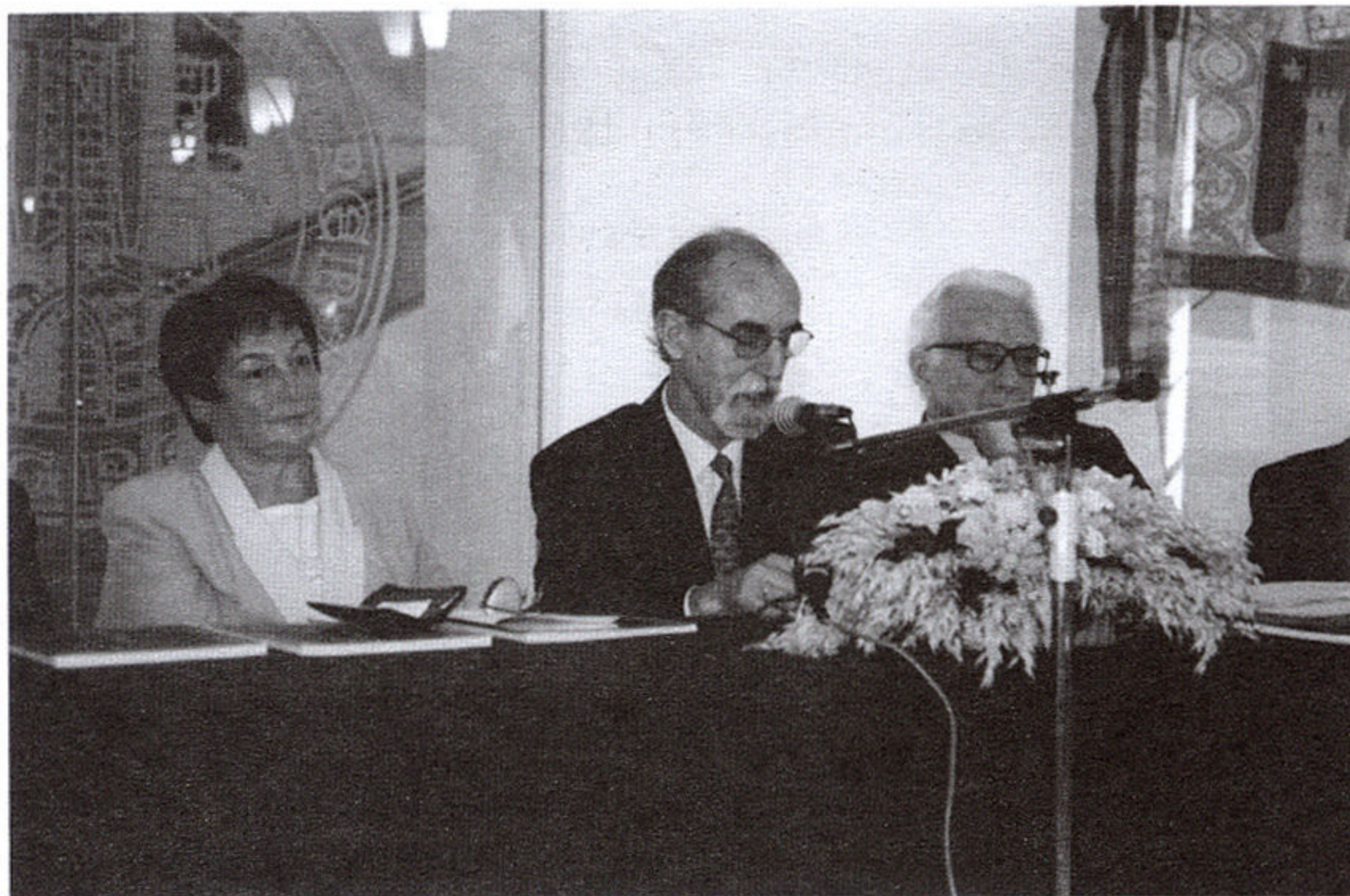
Kolegijalno zajedništvo: promocija knjige N. Premerl o stanju arhitekta V. Kovačića, MGZ, 2000.