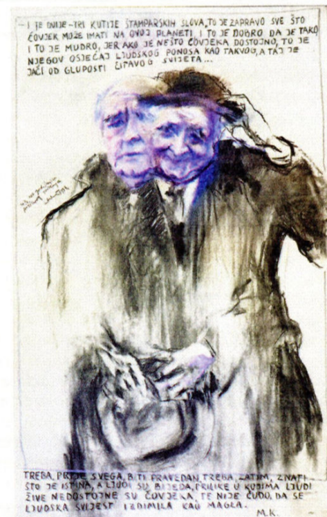
Zlatko Kauzlaric, Portret Miroslava Krleže , 1993.

lizacija ili formalnih redukcija. Ona je napravljena bez imalo energičnosti forme nužno potrebne portretu velikog književnika u javnom prostoru njegova grada ili zemlje.