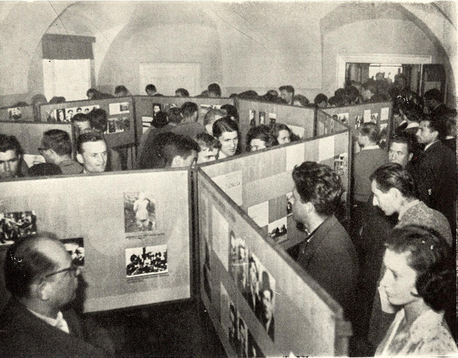
Pokretna izložba »Počeci Ustanka na području Zagreba« u prostorijama Muzeja Turopolja u Velikoj Gorici