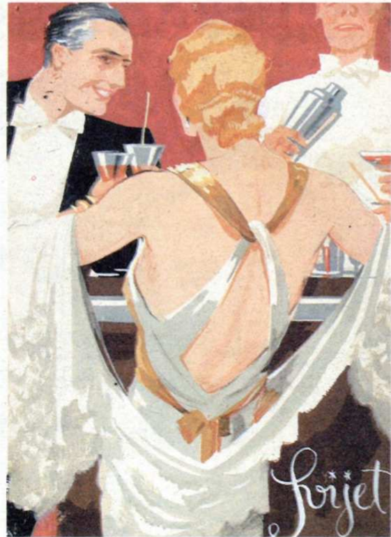
COCTAILS U BARU / Naš otmjeni svijet, predložak za naslovnicu od 30. 1. 1932.