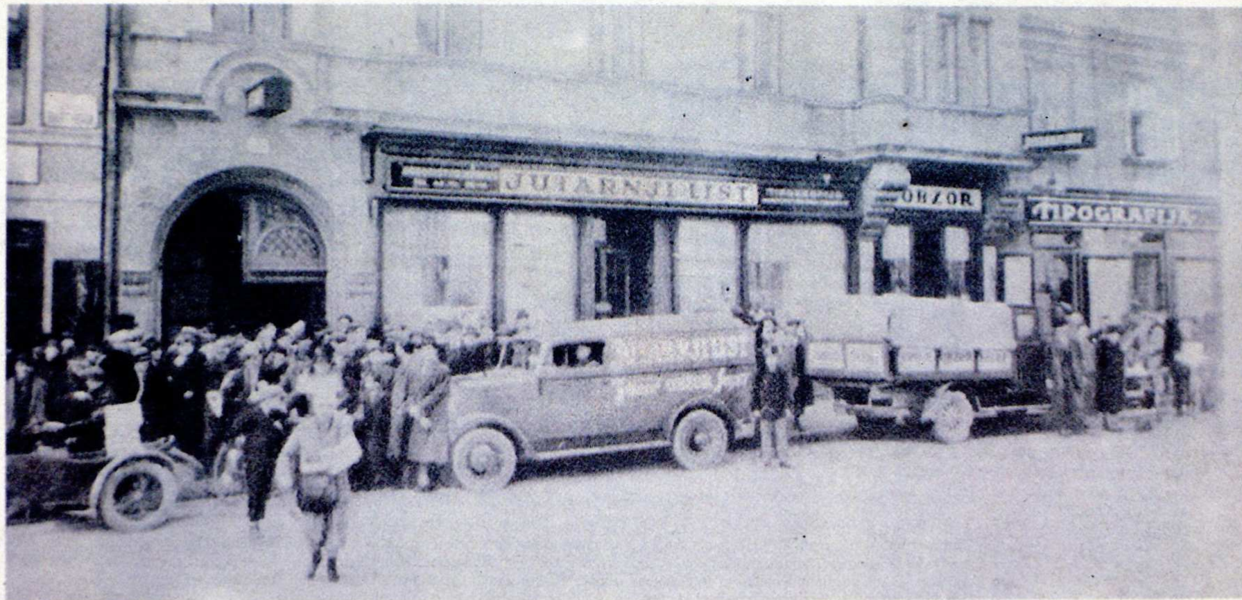
Svakodnevni prizor pred tiskarom »Jutarnjeg lista« i »Obzora«