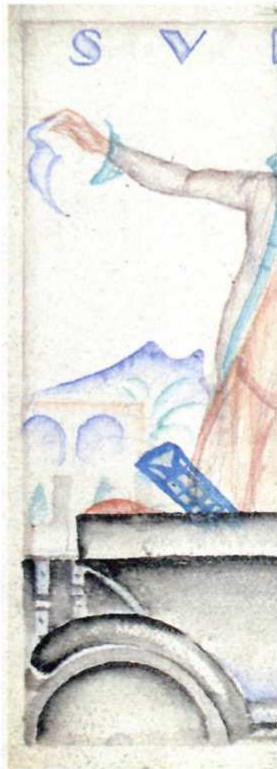
DAMA U KABRIOLETU 28. 8. 1926.