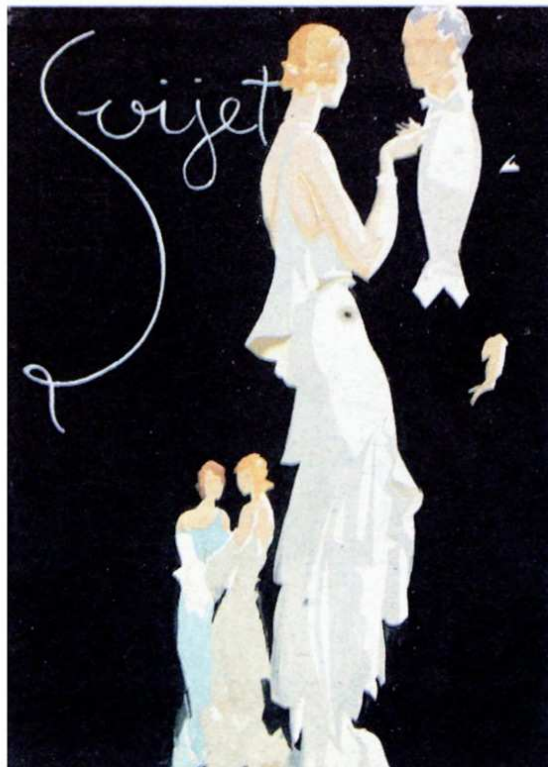
ELEGANTNE TOALETE ZA VEČER I PLES predložak za naslovnicu od 12. 12. 1931.