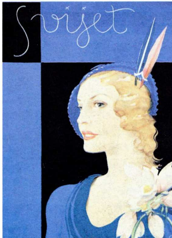
DAMA U PLAVOM predložak za naslovnicu od 5. 3. 1932.