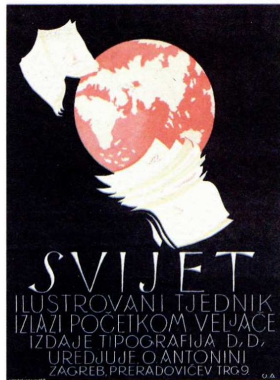
Zaštitni znak ilustriranog tjednika Svijet s objavom za pretplatu, 1926.