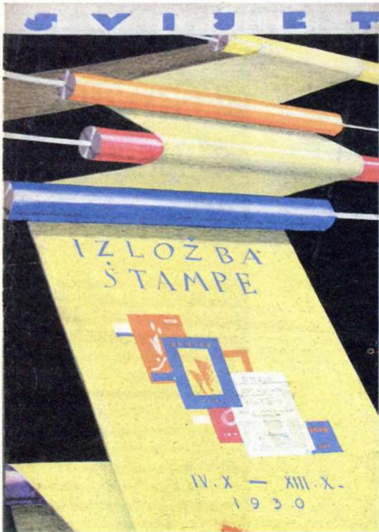
Izložba štampe na ZZ-u, predložak za naslovnicu od 10. 10. 1930. koja reklamira Tipografijina izdanja