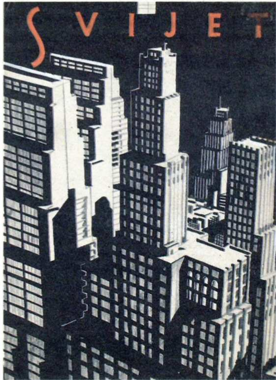
NEBODERI - simbol Amerike, predložak za naslovnicu od 23. 11. 1929.