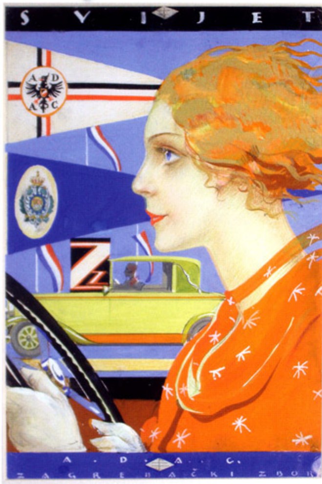
-A-D-A-C / AUTOMOBILISTICA Naslovnica tjednika "Svijet", Zagreb 20. IV. 1929. Cover of "Svijet", Zagreb 20. IV. 1929.