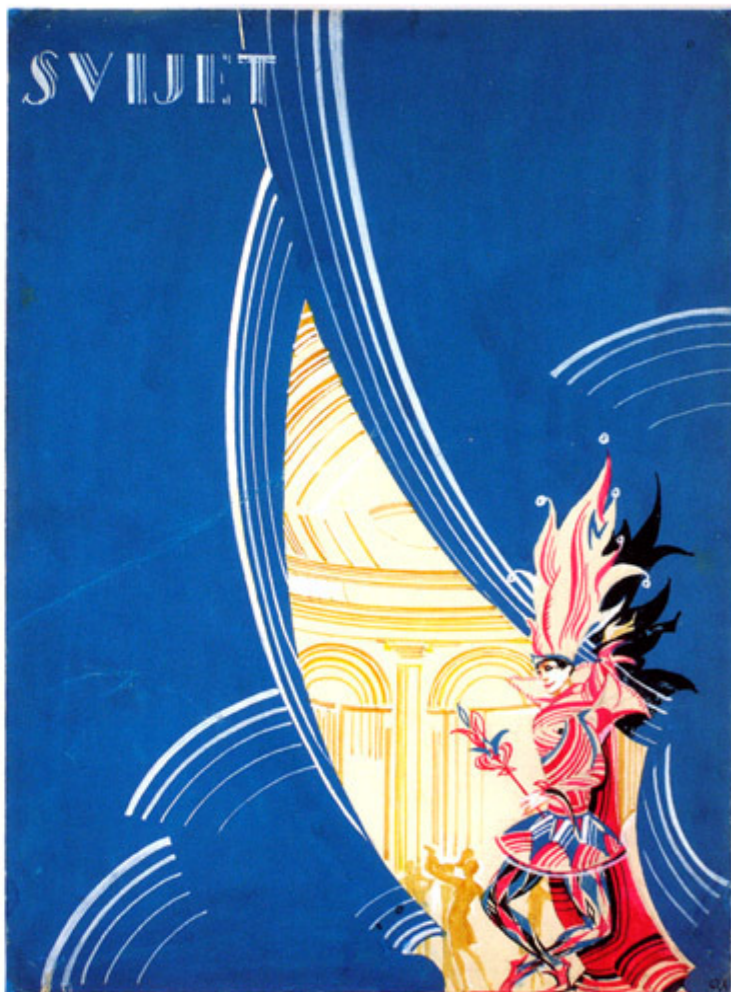
KARNEVAL - 1927. Pokladna reduta u Smaragdnoj dvorani hotela Esplanade Carnival redute in Esmeralde ballroom of hotel Esplanade

elite toga razdoblja. U tom kontekstu iznimno važno mjesto ima Hotel Esplanade kao „stjecište našeg elegantnog svijeta” - epitet koji ga prati od otvorenja 22. travnja 1925. godine - te stoga često prisutan u „Svijetu” fotografijom ili ilustracijom. Već u prvoj godini izlaženja, u rujnu 1926. godine, „Svijet” je na cijeloj stranici donio Antoninijev akvarel Terasa pred hotelom Esplanade . Prateći ilustracijom suvremene događaje te već tradicionalne događaje sezone u Zagrebu, u kojima je i sam bio sudionikom, Antonini je i osobno i profesionalno postao dio povijesti zagrebačke Esplanade. Bio je jedan od članova juryja koji je Zagrepčanki Štefeci Vidačić donio titulu prve „Miss Jugoslavije” 1926. godine na izboru ljepotice u organizaciji filmskog poduzeća „Phanament” iz Berlina koji je održan u velebnoj Smaragdnoj dvorani hotela 16. prosinca, a koju je ona potvrdila pobjedivši u natjecanju za „Miss Europe” 1927. godine.