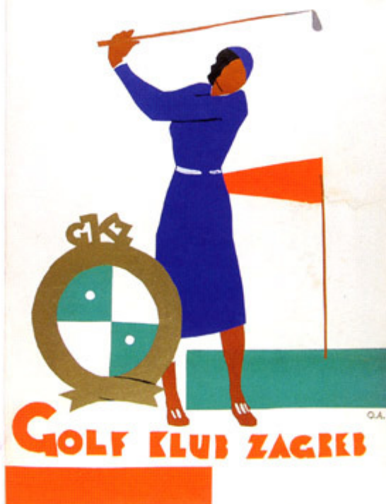
PLAKAT GOLF - KLUB ZAGREB Zagreb 1931 godine.

ties, his collection of illustrations from the covers of "Svijet" became an expression of the Zagreb elite lifestyle.