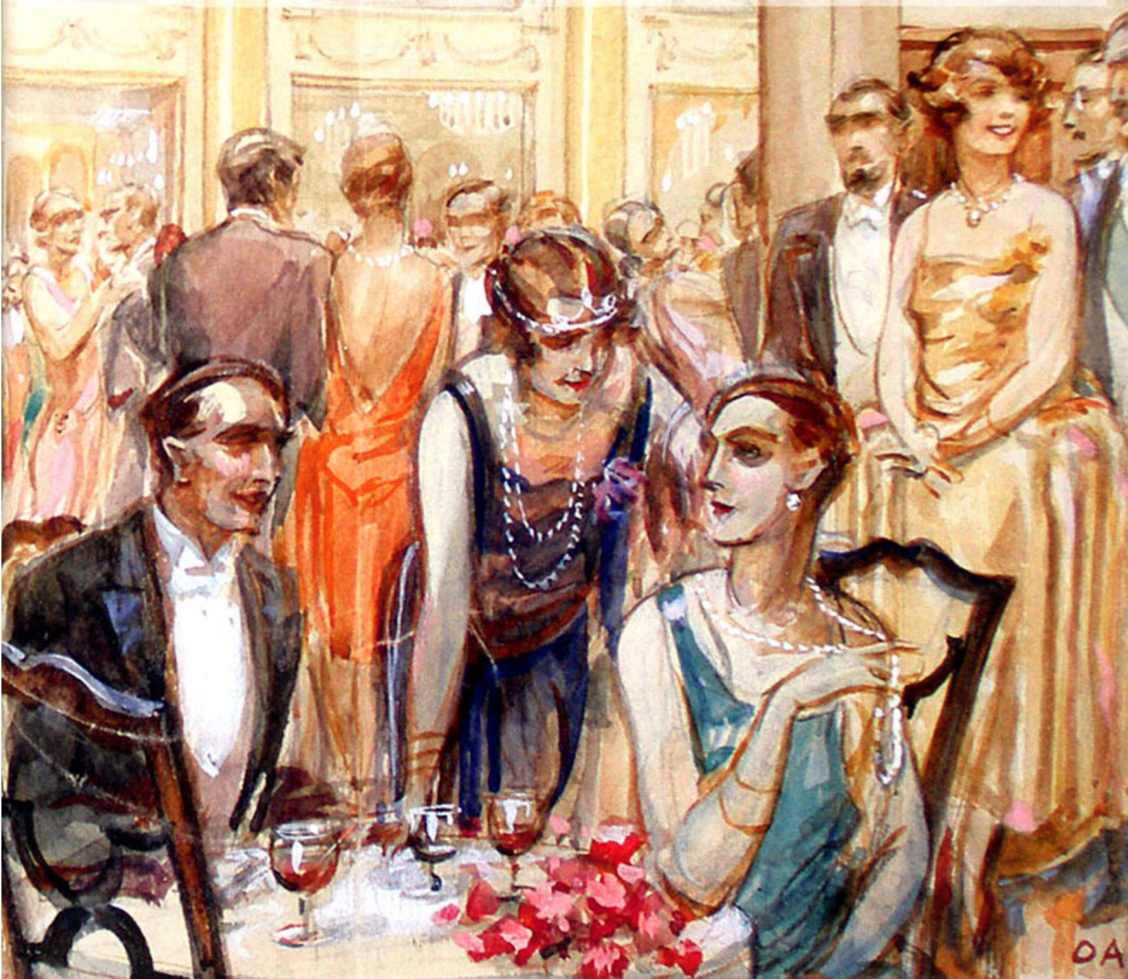
GALA AT ESPLANADE Illustration in weekly magazine “Svijet” - Zagreb 28. I. 1928.

By implementing the art deco style that felt so natural to this artist and gentleman, and presenting the trend of the artistic era of the twen-