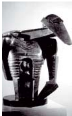
Rad Jacoba Epsteina

LONDON - Galerija Tate od 1. rujna pokrenula je projekt »Tate Tracks« na granici glazbe i likovne umjetnosti. Osam poznatih glazbenika, od Chemical Brothers do Estelle, skladat će po jednu pjesmu inspiriranu nekim od radova izloženih u galeriji. Svakog mjeseca novu će skladbu posjetitelji moći poslušati slušalicama, a pred eksponatom koji je potaknuo na stvaranje. Odabrani su radovi umjetnika poput Andyja Warhola, Mana Raya, Jacoba Epsteina i Donalda Judda. [V. R.]