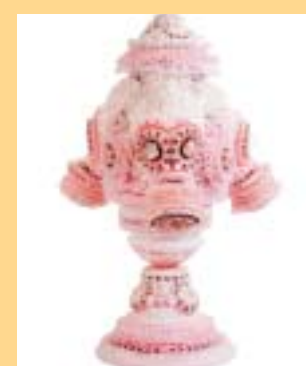
Uvijek provokativan: Rad Kristiana Kožula

Za uistinu izniman završetak godine Muzej za umjetnost i obrt priprema izložbu »Leonardo da Vinci: Atlantski zbornik«, priču o bogatstvu sadržaja, značenju i nastanku najcjelovitije zbirke ostavštine genijalnog Leonarda. U originalnim otiscima iz razdoblja između 1894. i 1904. u Atlantskom su zborniku sadržani crteži strojeva, tajnih vještina i drugoga što je osmislio Leonardo da Vinci.