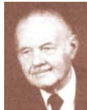
Fra Lucijan Kordić

Književnim djelom koje se natječe za nagradu, smatra se zbirka pjesama, roman, zbirka pripovijedaka, zbirka novela i zbirka putopisa, a tematski, na bilo koji način, obrađuje život Hrvata izvan domovine. Nagrada iznosi tri tisuće švicarskih franaka i bit će dodijeljena na blagdan sv. Franje, 4. listopada 2006. godine. Lucijan Kordić (1914.-1993.), književnik, franjevac, bio je osnivač i urednik nakladničke kuće ZIRAL. Objavljivao je pjesme, pjesničku prozu, kritike te književne i teološke članke. Sastavio je i antologiju »Hrvatska iseljenička lirika«. [Hina]