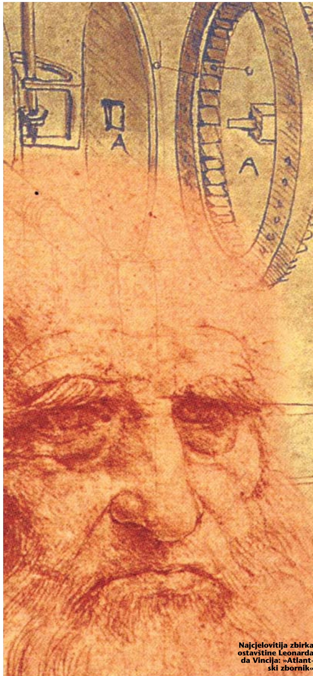
Najcjelovitija zbirka ostavštine Leonarda da Vincija: »Atlantski zbornik«