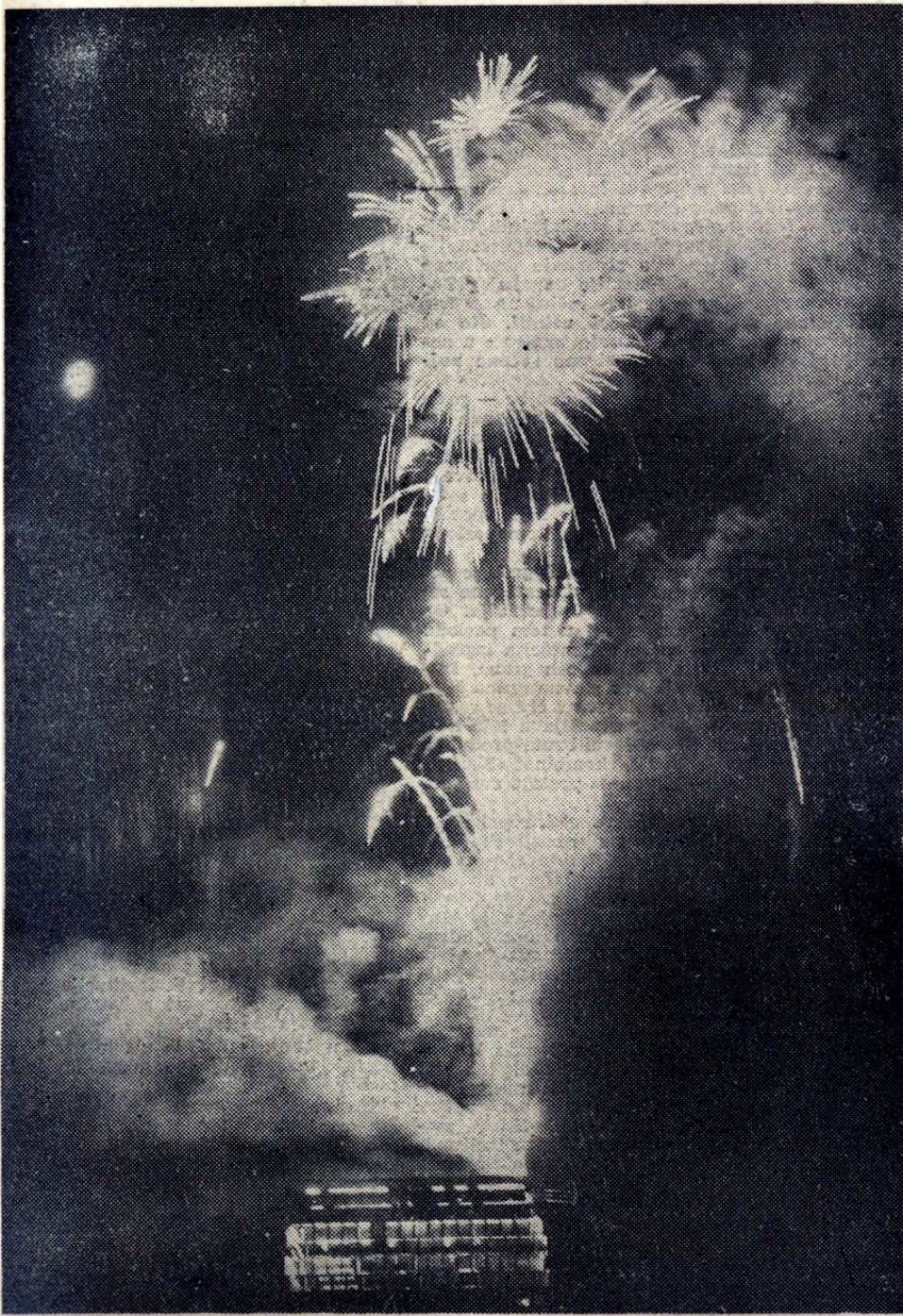
Raznobojne rakete poletjele su sinoć visoko nad Trg Republike. U svim dijelovima grada vatromet su promatrale tisuće i tisuće Zagrepčana.