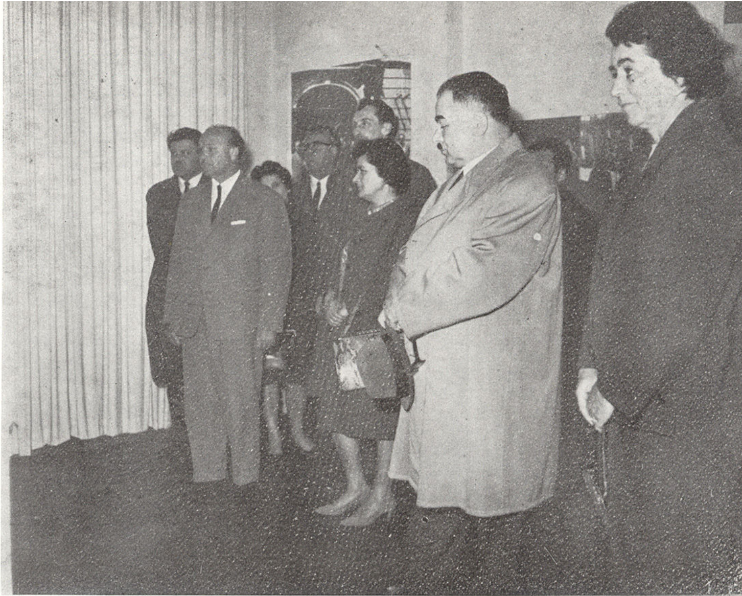
S otvorenja izložbe »Oslobodenje Zagreba«