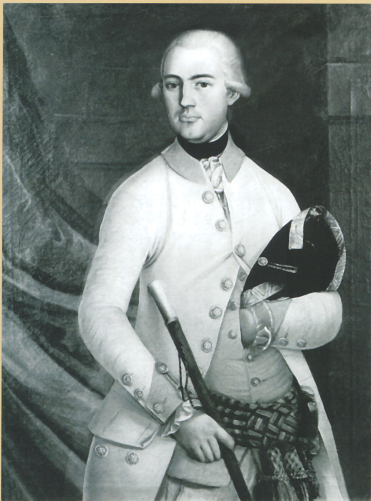
IVAN NEPOMUK ORŠIĆ