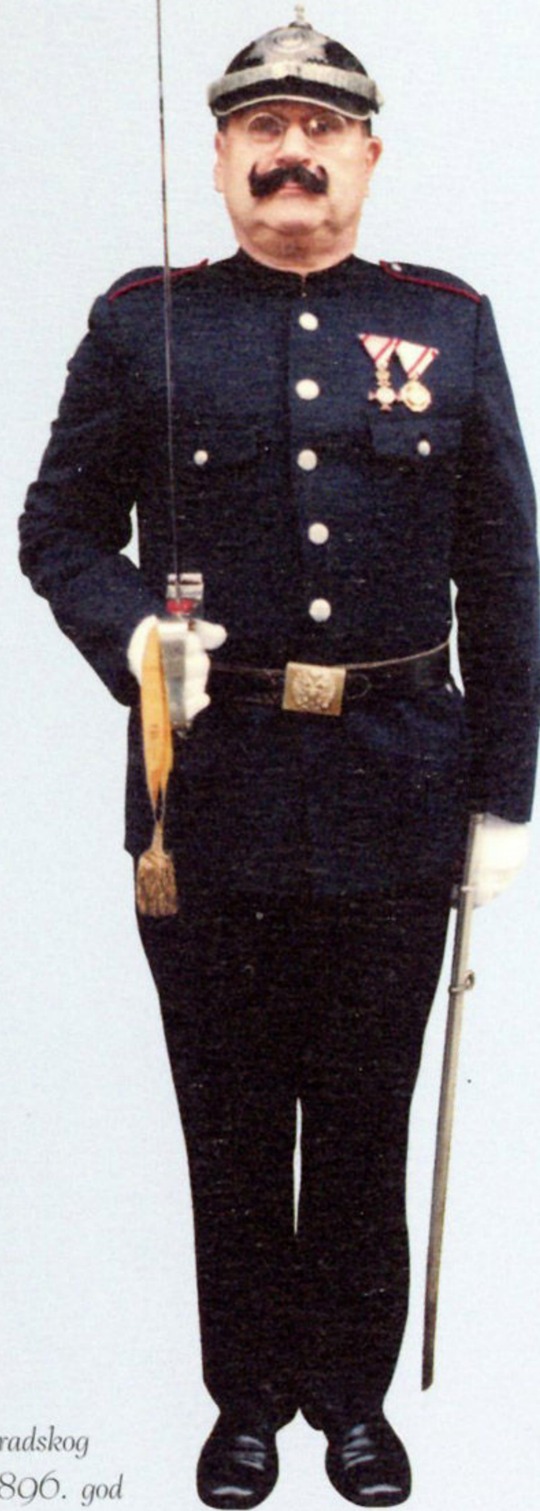
Uniforma gradskog stražara, 1896. god