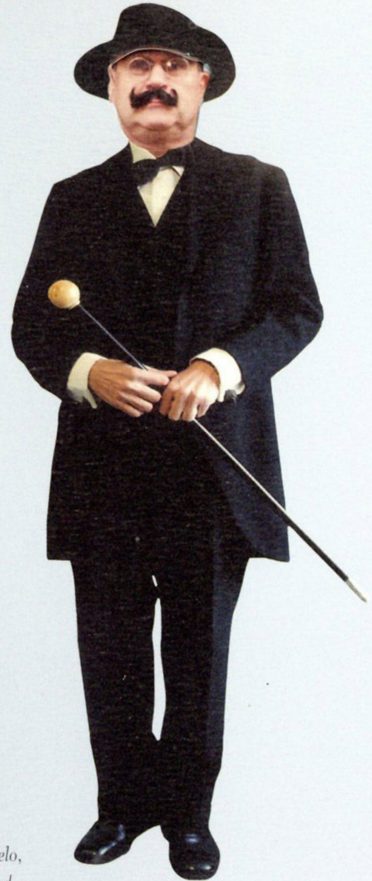
Elegantno odijelo, oko 1920. god