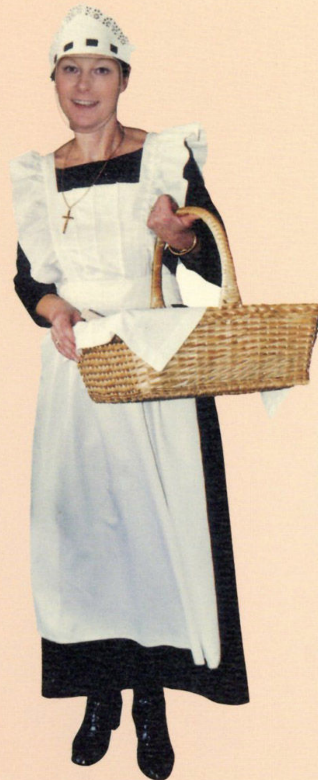
Prodavačica peciva, kraj 19. st.

U hladnim predjelima čovjek se odijeva u krzno jer ga ono najbolje štiti od hladnoće