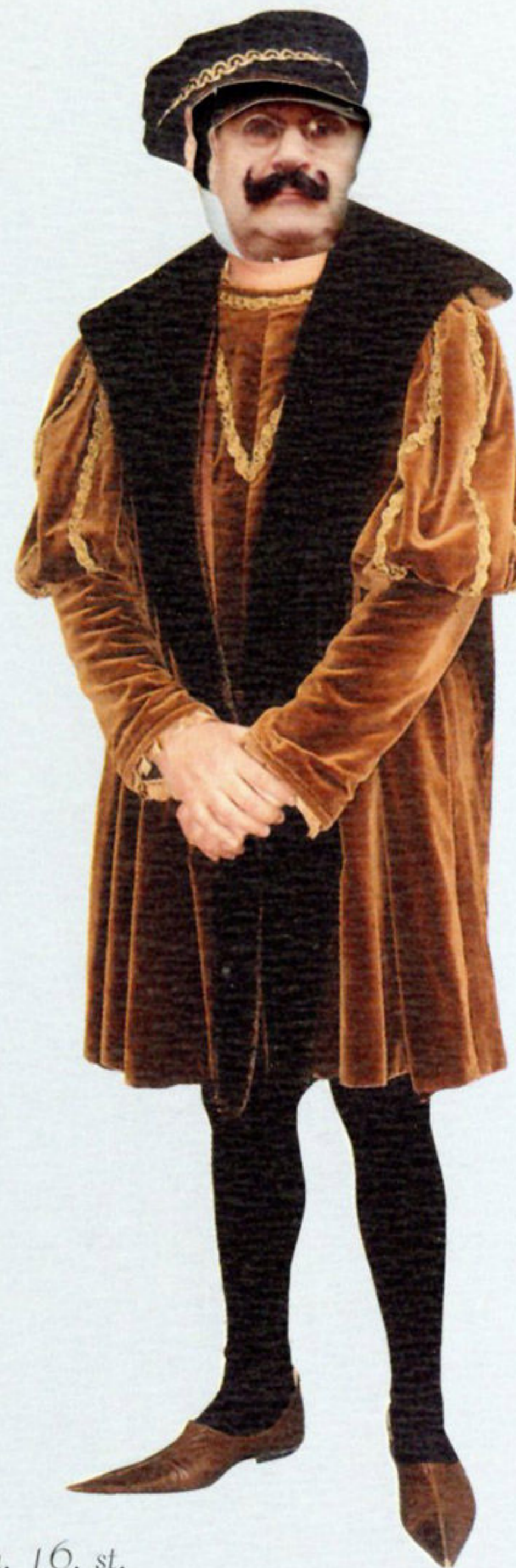
Plemićka odora, 16. st.

Društvene i klasne razlike u prošlosti bile su vidljive i kroz odjeću. Od 14 st., odjećom se naglašava razlika prema spolu – do tada su muškarci nosili odjeću nalik na duge haljine. I u današnje se vrijeme odjećom i vizualno razlikujemo: po spolu, po godinama, po pripadnosti određenoj skupini, po poslu koji radimo – neka zanimanja zahtijevaju uniformu – po aktivnostima (sport), po društvenom statusu i drugom.