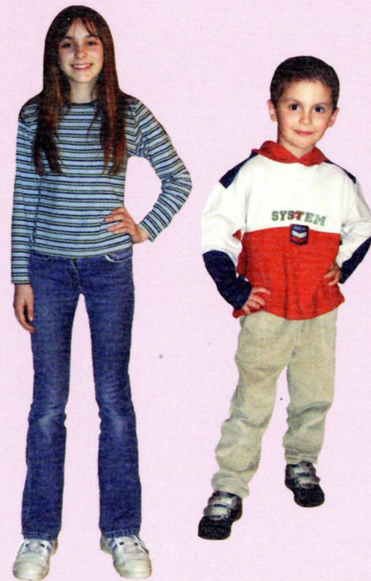
Svakodnevna odjeća, 2004. god.

Naša prosudba o tome kako se pojedinac, ili skupina, odijeva često je različit. Ona ponajprije ovisi o našem kulturnom nasljeđu, sredini u kojoj živimo, poslu kojeg obavljamo i što je najvažnije – o našem viđenju osobe čiji način odijevanja procjenjujemo.