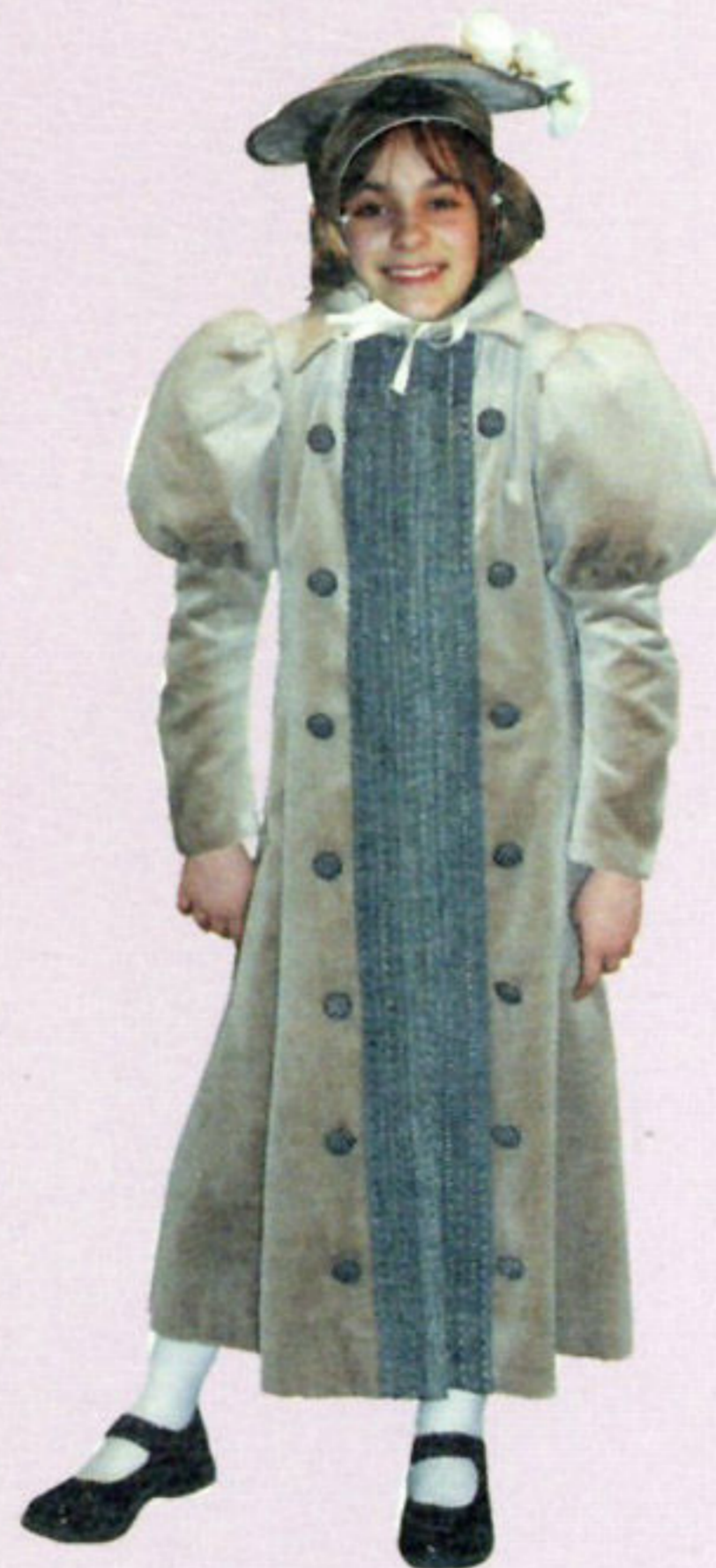
Odjeća djevojčice za kostimirani ples, kraj 19. st.

Govoreći o odjeći, ili bolje rečeno o modi, potrebno je istaći kako je ona odraz ekonomskih i društvenih odnosa jednoga vremena. Odjeća ima značajnu ulogu u potrošačkom društvu današnjice. Ona je, obrtajem velike količine novca, bitan čimbenik gospodarskog sustava suvremenog Svijeta. Upravo iz toga razloga i