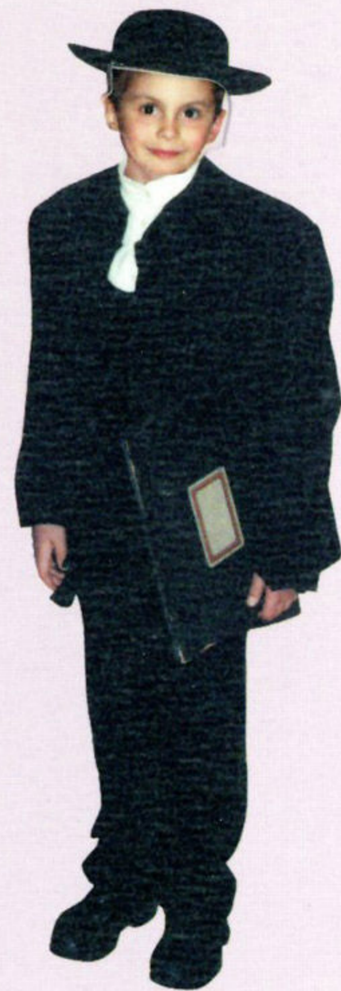
Odjeća gimnazijalca, oko 1880. god