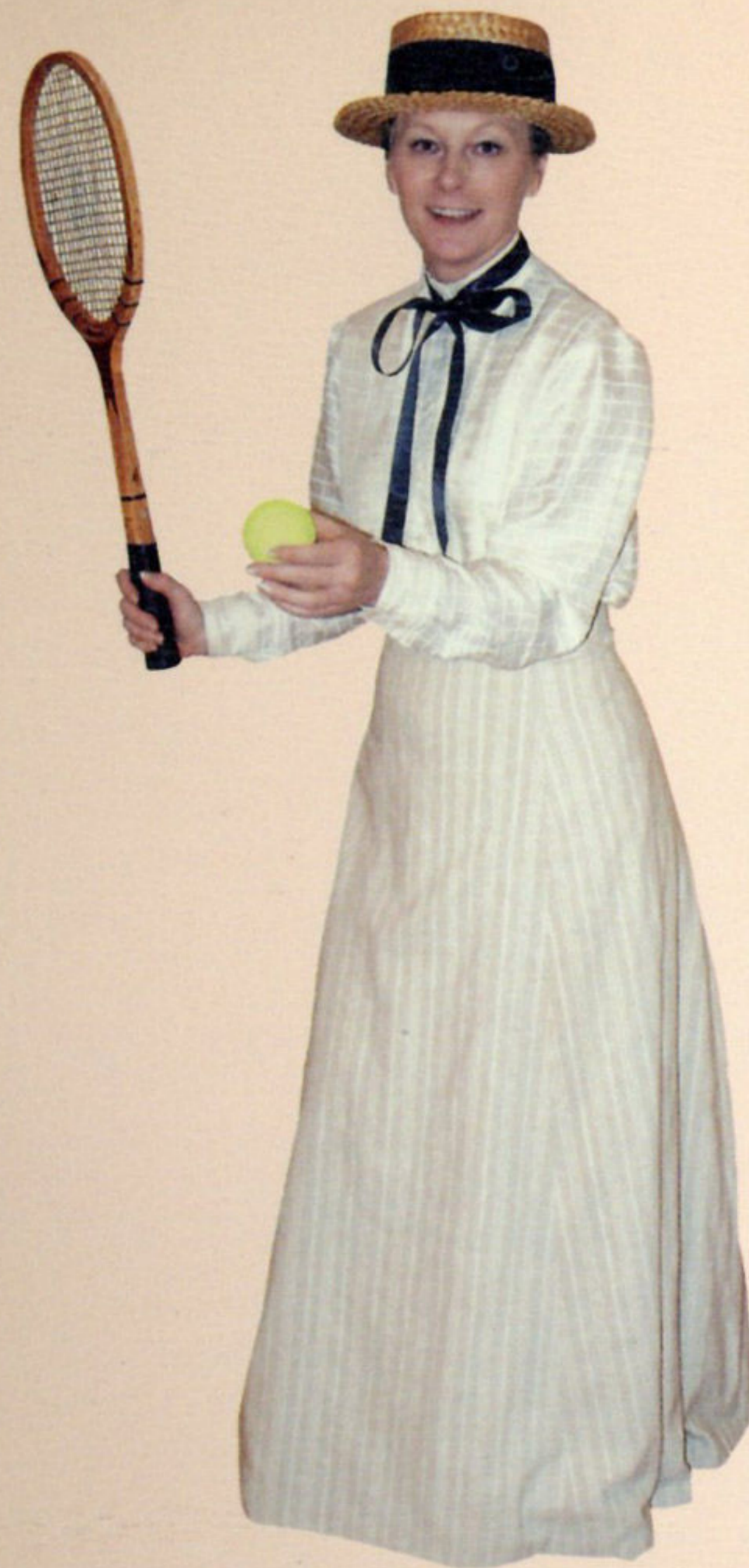
Ženski sportski kostim za tenis, kraj 19. st.

Kroz cijelu povijest odijevanja postojale su i postoje osobe koje, više od ostalih, žele sebe prikazati u jednom drugom svjetlu. Načinom odijevanja šalju drugima najblis-taviju i najlaskaviju sliku o sebi, odnosno odašilju signale svoga vlastitog unutar-njeg zadovoljstva.