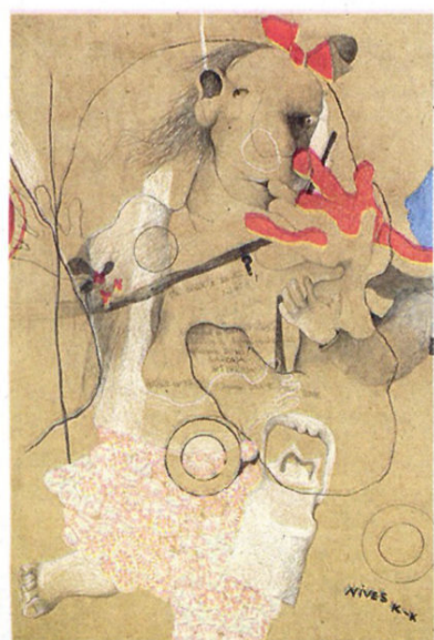
ETNOGRAFSKI MUZEJ, MGZ, KLOVIĆEVI DVORI