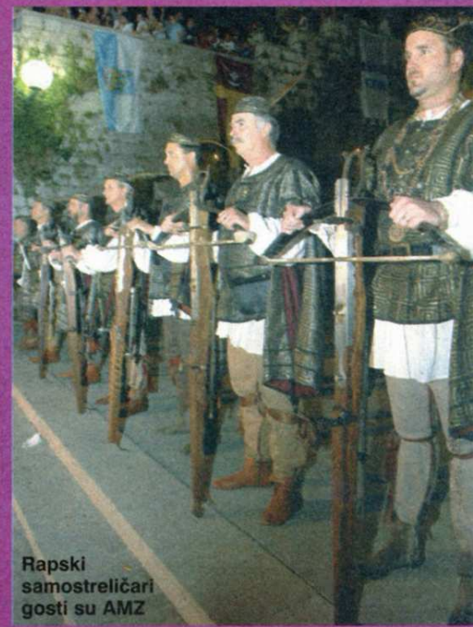
Rapski samostreljari gosti su AMZ