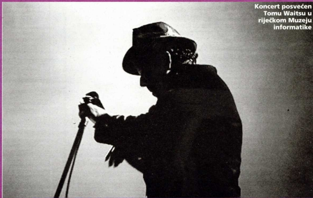
Koncert posvećen Tomu Waitsu u riječkom Muzeju informatike