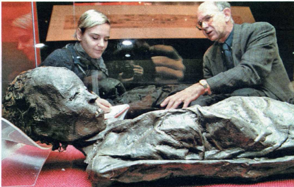
Što radi mumija nakon ponoći doznat ćete u zagrebačkom Arheološkom muzeju

Kao i uvijek jedan od najatraktivnijih programa načinili su kustosi Arheološkog muzeja Zagreb pa će gosti Noći muzeja osim stalnih zbirki vidjeti otvorenje izvanredne izložbe i publikacije Sanjina Mihalića »Arheologija i turizam«, vidjeti izradu pretpovijesnih alati, upoznati manifestaciju Sepomaia viva uz žive nastupe rapskih samostreljara, zagorskih vitezova (!) i predstavnika »Plemena bosutskog šarana«, sve uz prodaju atraktivnih suvenirna.